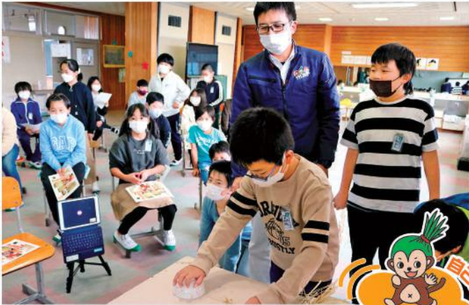
茶碗を使って脱穀体験をする児童