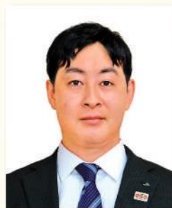
上都賀農業協同組合 監事