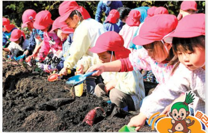
一生懸命にイモを掘る園児