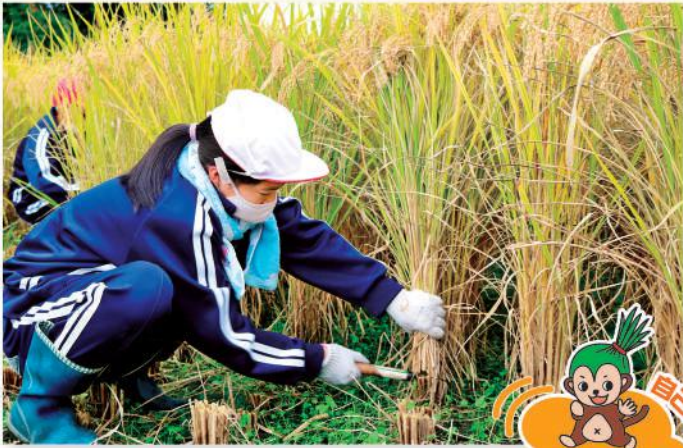
稲刈りに取り組む児童