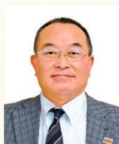
上都賀農業協同組合 監事