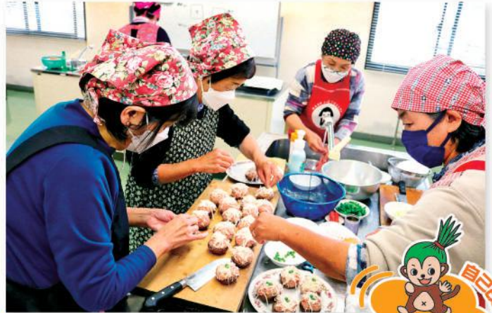
しいたけしゅうまいを作る参加者