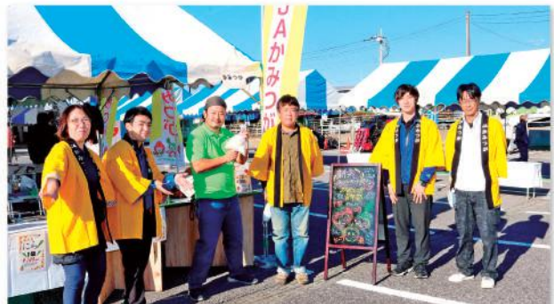
(米、ニラ、トマトなどを販売)