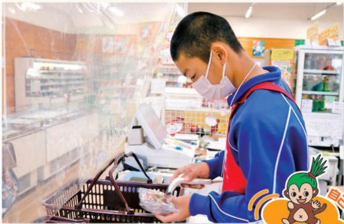
直売所でレジ打ちを行う生徒