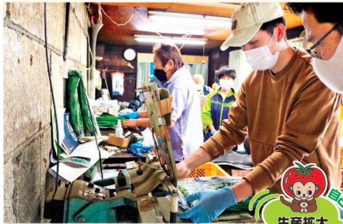
出荷調整作業を行う参加者