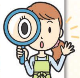
出題・パズルイラスト 酒井栄子