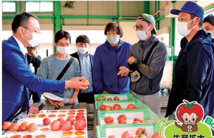
出荷規格を確認する部員