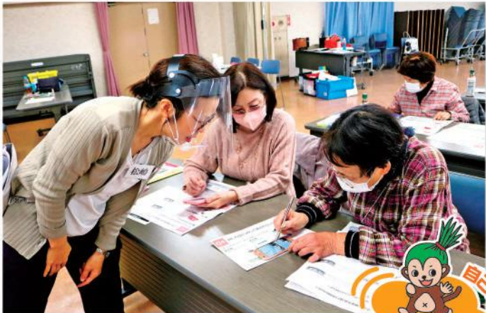
スマホ操作を学ぶ参加者