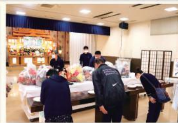
10月1日 森友ホールにて