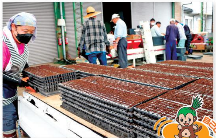
播種を行う組合員