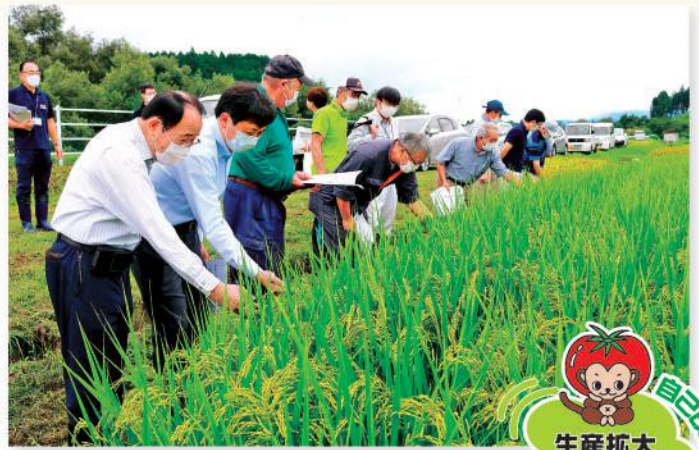
生育状況を確認する参加者