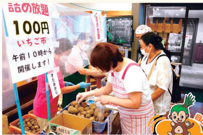
じゃがいも詰め放題の様子