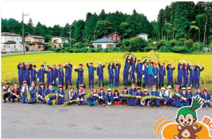
収穫前に記念に一枚！