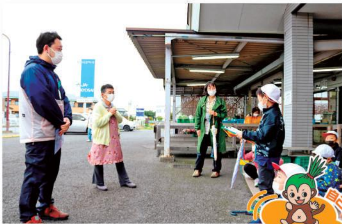
高橋組合長とJA職員に質問する児童