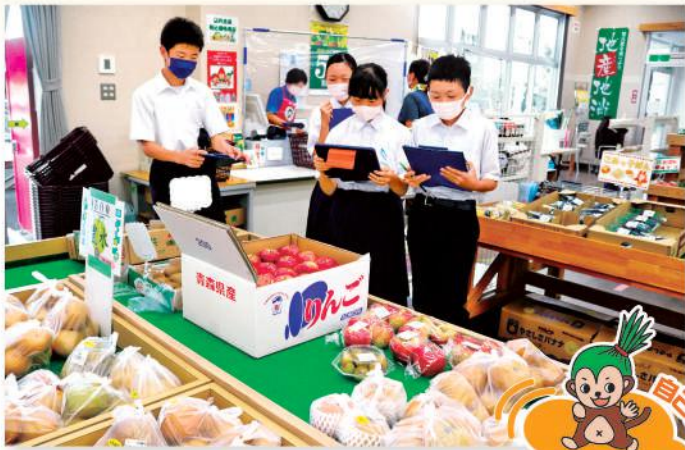
直売所の売り場を見学する生徒