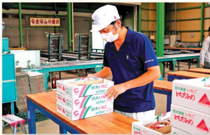
イチゴの品質を確認する担当者

今年産のイチゴは、天候不順や猛暑で育苗、ハウス管理に厳しい状況が続いたものの、生育は順調に推移しています。