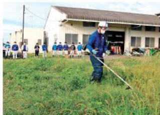
刈り払い機を使用する職員

JAかみつがは10月16日、南部宮農経済センターで、JA職員の刈り払い機取り扱い研修会を実施しました。全農とちぎ農業機械推進課、株式会社丸山製作所、JAかみつがサービス株式会社が参加。若手職員を中心に13名の職員が、座学や実習を通して、刈り払い機の使用方法を学びました。職員向けの刈り払い機の研修を行ったのは初めてです。