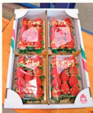
出荷されたとちおとめ