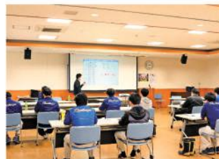
農作業の事故について真剣に学ぶ参加者

実習では、同センター内の敷地で、順番に刈り払い機のエンジンをかけ、数メートル分の草刈りを行いました。職員は「体験したことがなかったが、この経験から組合員さんとの会話も弾むようになる」「事業所内の草刈りで使用方法を復習したい」と話しました。