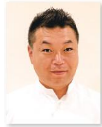
上都賀総合病院 栄養課 係長