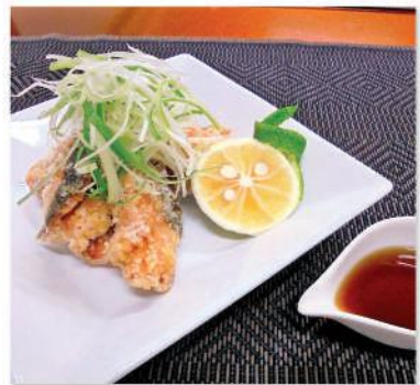
鮭の選び方(切り身)