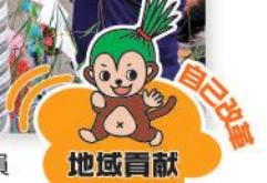
七夕飾りを行う女性会員とJA職員