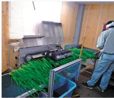
写真2 水圧式にら洗浄そぐり機

出荷調整作業はにらの生産における労働時間の約6割を占めています。平成30（2018）年から管内で導入が進む「水圧式」にら洗浄そぐり機は、収穫後のにら調整を行うもので、従来の圧搾空気式