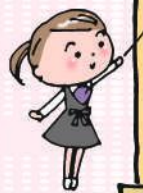
イラスト:小林裕美子