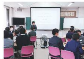
研修会 「虹の仲間づくりカレッジ」

兵庫県協同組合連絡協議会とコープこうべが共催でそれぞれの職員の人材育成を行っています。JAや生協等、協同組合の次世代を担う職員同士が顔の見える関係をつくり、地域の中で協同組合が果たすべき役割を共に考えるための研修を実施しています。参加者は現地調査やボランティア活動等に取り組む、報告会を行っています。