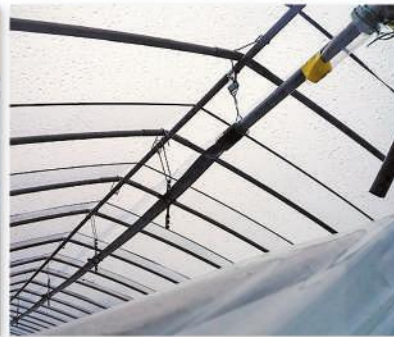
写真1 ウォーターカーテン

のハカマムキ機と比較して作業時間を短縮できます。管内では現在、個人および共同利用で10台導入されています。また、栃木県版にらそぐり機についても、地元企業、宇都宮大学、栃木県の産学官が連携して研究開発を進めており、来春には試作機の完成を目指しています。