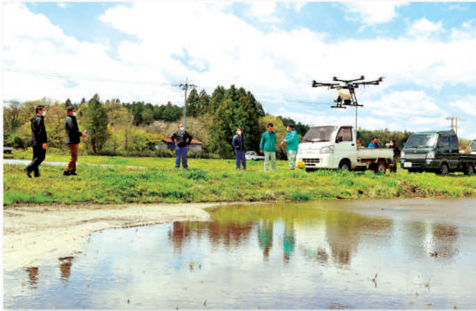
飛行訓練を行う参加者