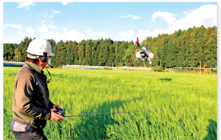
ラジヘリを操縦するオペレーター