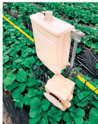
環境測定センサー

イチゴをはじめとした施設園芸ではICT機器を導入し、栽培環境を把握、改善することで単収の増加や品質の向上などを目指す取り組みが拡大しています。ハウス内環境をモニタリングする機器を使うことで、生育に大きな影響を与えるハウス内の温湿度、炭酸ガス濃度などの様々な環境要因をリアルタイムで計測でき、その推移を確認しながら栽培管理を行うことができます。計測したデータはパソコンやスマートフォンで見ることができるので、外出中でも確認が可能となります。