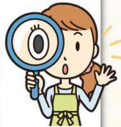
出題・パズルイラスト 酒井栄子