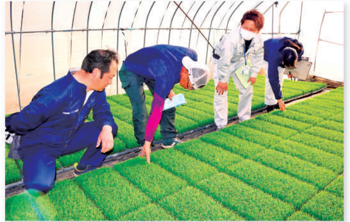
生育状況を確認する参加者

同市内では、ドローン普及が進み会員が増加、設立当初の7人から23人となっています。