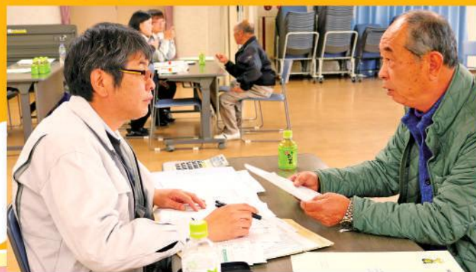
記帳の説明をするJA職員

相談者1人につき約1時間、年末調整の確認と平成31年度（令和元年度）の決算準備に向けた面談が行われ、記帳代行の説明をしました。