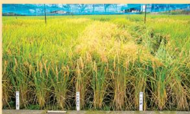
写真1 夢ささら(中)と粒と立毛 ※粒・立毛とも、左からあさひの夢、夢ささら、山田錦