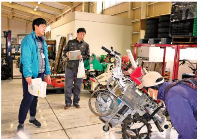
日光にら専門部会で使用している共同播種機