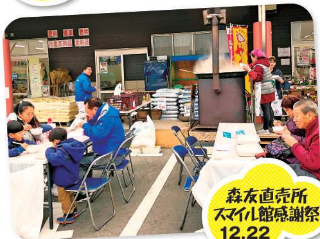
森友直売所 スマイル館感謝祭 12.22

各直売所では、 地元の新鮮な野菜を 使用した汁物の提供、 直売所組合員による つきたてお餅の提供 など、会場は盛り 上がりました。