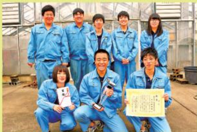
大賞を受賞した野菜研究班メンバー

2017年から始まり、地域振興に貢献する優れた農業の取り組みをしている中から全国15校を選び、3年間の活動を支援しています。17年に支援対象となった15校の3年間の活動期間を終え、同校は見事初の大賞となりました。