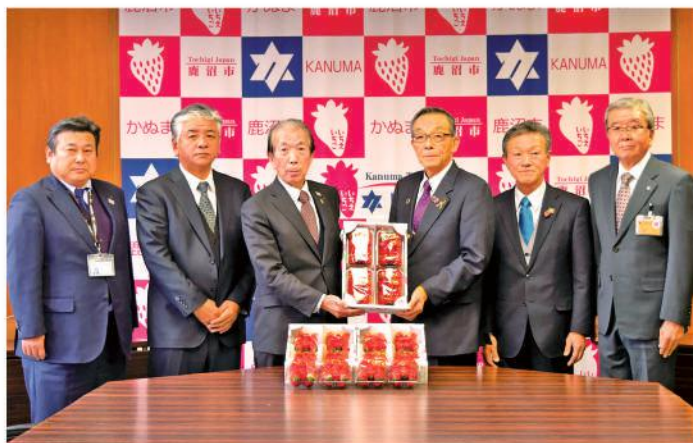
鹿沼市へイチゴを贈呈

大橋組合長は「子どもたちが食べたときの笑顔が楽しみ。これを機会に農業や地域に興味を持ってもらいたい」と願いを込めます。