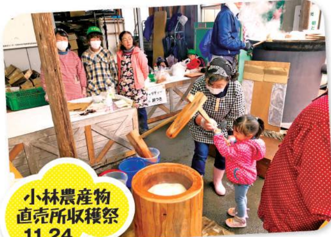
小林農産物 直売所収穫祭 11.24