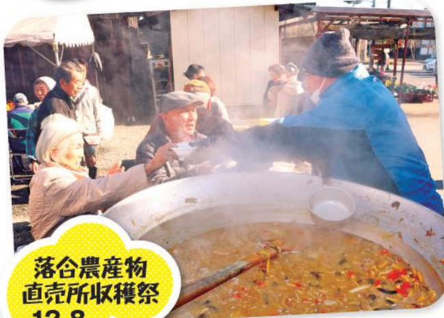
落谷農産物 直売所収穫祭 12.8