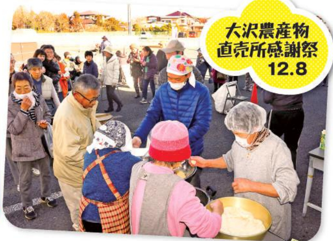
大沢農産物 直売所感謝祭 12.8