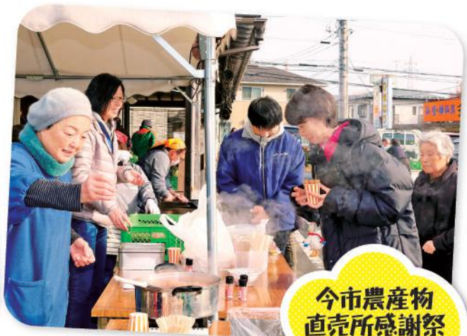
今市農産物 直売所感謝祭 12.15