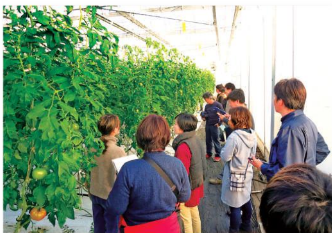
ほ場を確認する部員と女性農業者

参加した女性農業者は「他の施設やトマトを見る機会が少ないので、様々な作り方がある事を学べて良かった。我が家での栽培に活かしていきたい」と意気込みます。