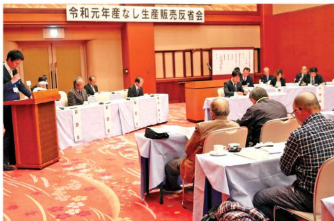
次年度に向けて検討する部員