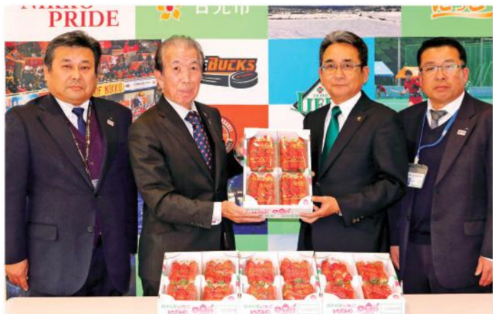
日光市へイチゴを贈呈