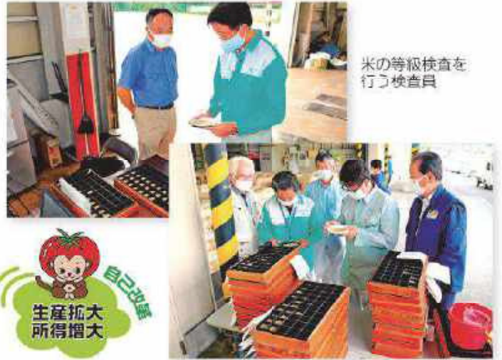
米の等級検査を行う検査員