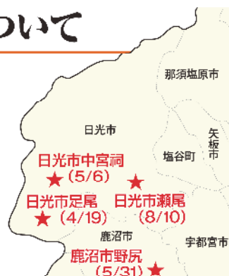
上都賀管内における豚熱に感染した野生イノシシ確認地点（ ）内：発見日

豚熱をはじめとする家畜伝染病の発生やまん延防止には、畜産農家自らの防疫対策の徹底はもとより、 一般の方々のご理解とご協力が必要となります。