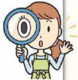
出題・パズルイラスト 遠井栄子