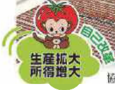
協力して種まき作業を行う組合員