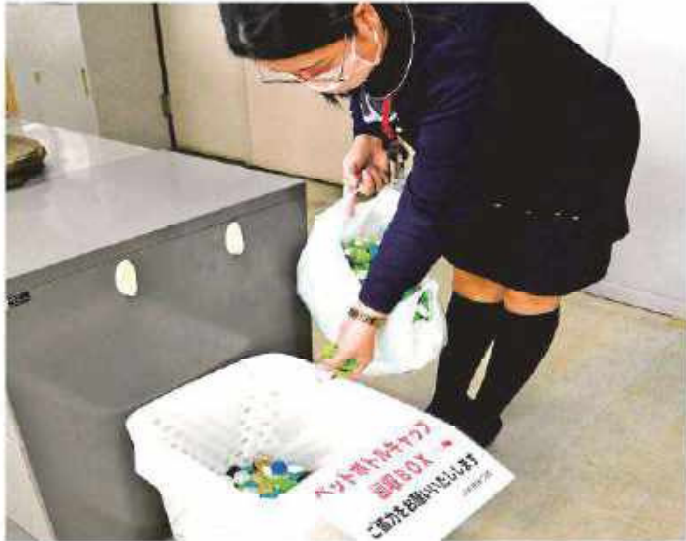
ご協力よろしくお願いいたします