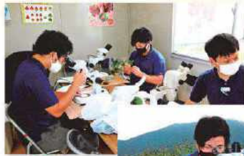
分化状況を 確認する職員