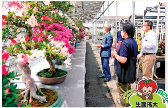
出荷規格を確認する会員