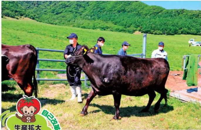
牛を搬入する生産者(上栗山牧場)