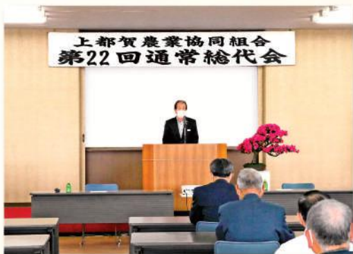
あいさつをする大橋組合長

JAかみつがは5月28日、JAかみつが本店で第22回通常総代会を開きました。新型コロナウイルスの感染予防対策で小規模の開催となり、総代626名（本人出席29人・書面出席420人）が出席しました。