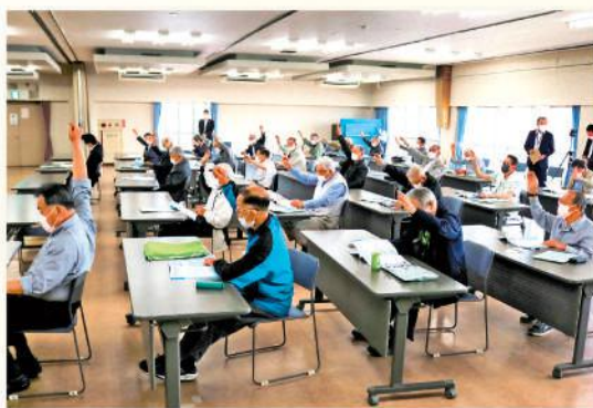
議案の承認に挙手をする総代

令和2年度は「創造的自己改革への実践3か年計画」の2年目として事業運営に努めました。令和3年度につきましても、3か年計画の最終年度として引き続き自己改革に取り組み、組合員・利用者のため、地域農業の振興を実践してまいります。