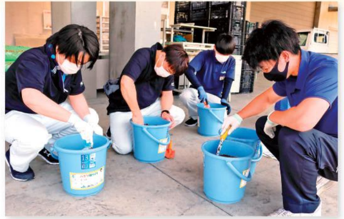
バケツ内の土を混ぜる職員