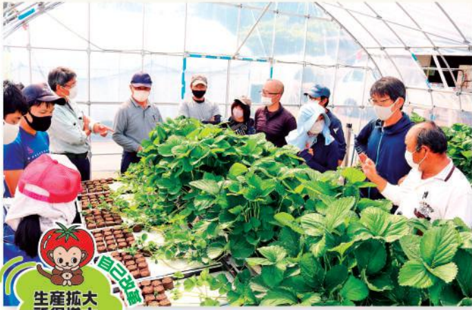
育苗状況を確認する部員