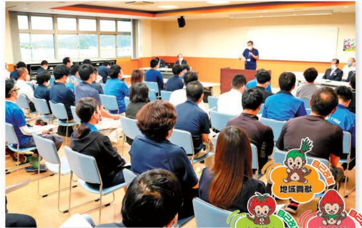
決意表明する職員