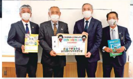
日光市教育委員会へ贈呈