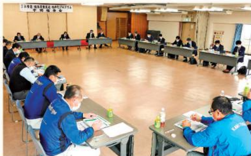
中間報告会で方針を検討

中間報告会では、営農経済事業改革コンセプトを「ALLかみつが協働・共創の覚悟で未来を拓く」とし、出向く営農体制の確立により、安定的な収益と組合員への還元を図ること、人的、物的資産を結集し持続的な事業力と財務体質の強化を図ることを方針として掲げました。