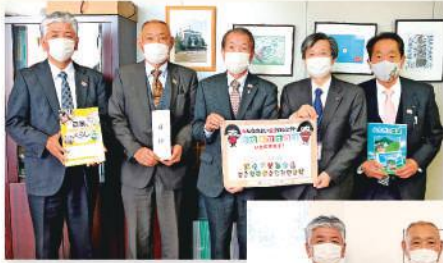
鹿沼市 教育委員会へ 贈呈