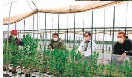
3.19 JAかみつが 日光花き部会 りんどう研究会