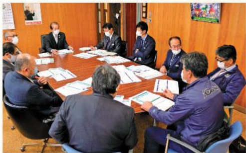
プログラムの検討を行う役員と支援チーム

JAかみつがでは、昨年12月に営農経済事業成長・効率化プログラムのキックオフ大会を開きました。同プログラムでは、持続可能な経営基盤の確立・強化に向けて、JAグループ各連合会と協働して取り組み、営農、経済事業の収支改善と農業者の所得向上を目指していきます。