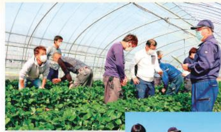
3.17 JAかみつが いちご部(とちあいか 現地検討会)