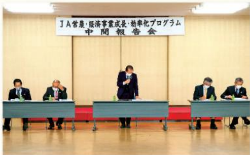
中間報告会で意気込みを話す大橋組合長

実践支援チームがこれまでの調査、分析した中から販売、生産、利用、葬祭などの部門を含めた11のソリューション(改善方策)を取りまとめて発表しました。