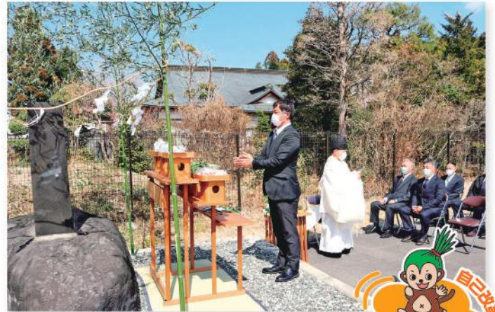
畜魂碑の前で祈りを捧げる参加者