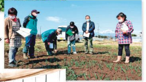
3.16 小林地区 玉ねぎ生産組合