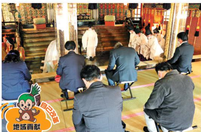
五穀豊穡を祈る参列者