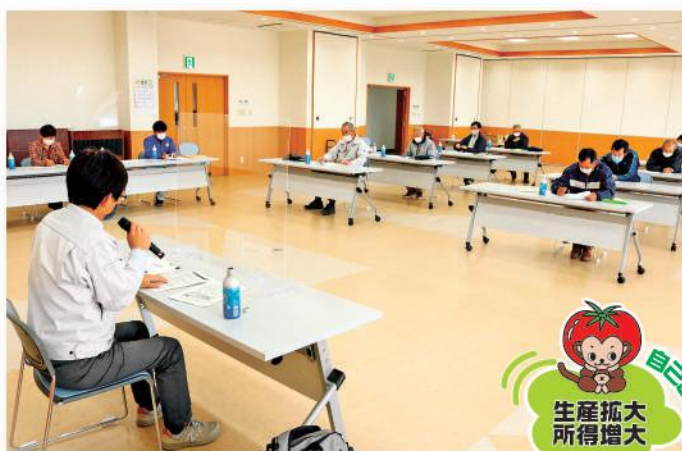
令和3年産の栽培管理を学ぶ会員