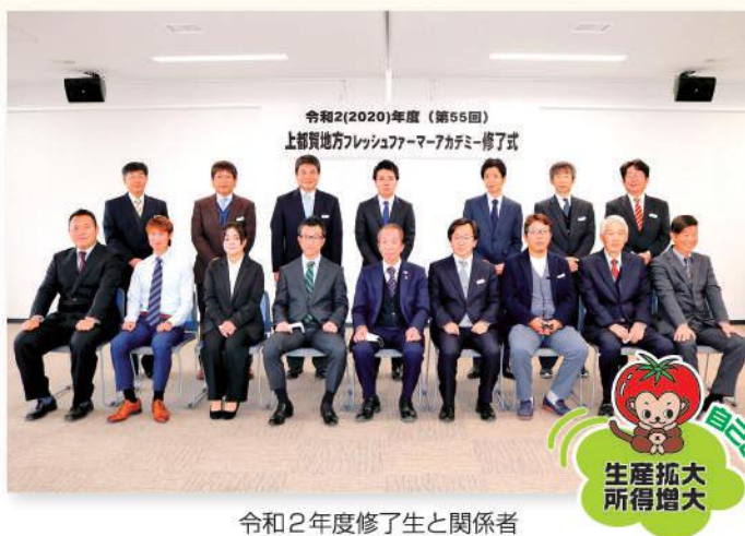
令和2年度修了生と関係者