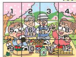
出題・パズルイラスト 酒井栄子