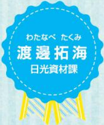
わたなべ たくみ 渡邊拓海 日光資材課