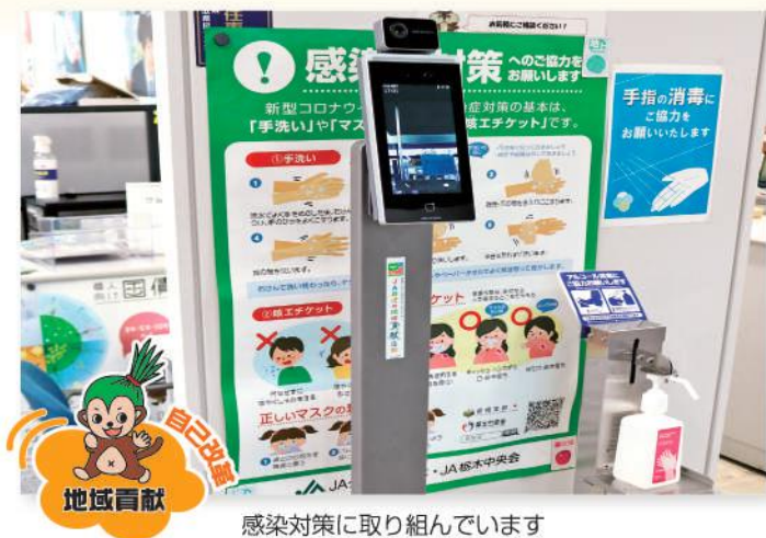
感染対策に取り組んでいます