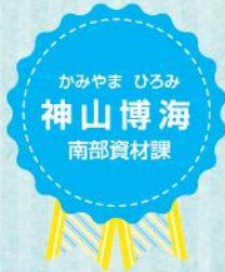
かみやま ひろみ 神山博海 南部資材課