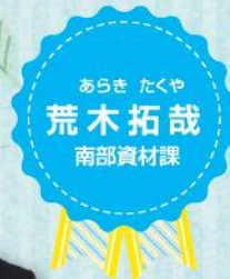
あらい たくや 荒木拓哉 南部資材課