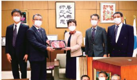
大川市長(中央)へ贈呈する江俣部長