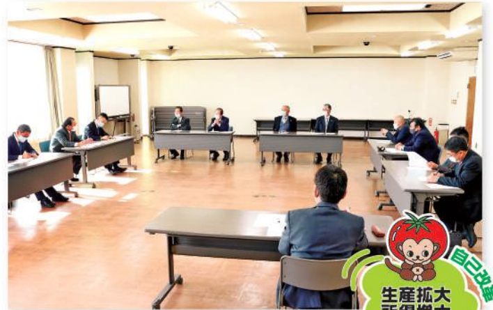
農業の課題について懇談