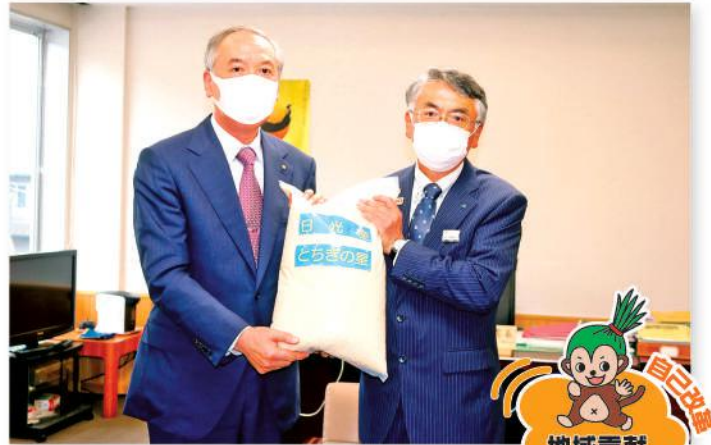
とちぎの星を贈呈する大嶋会長(右)と齋藤教育長