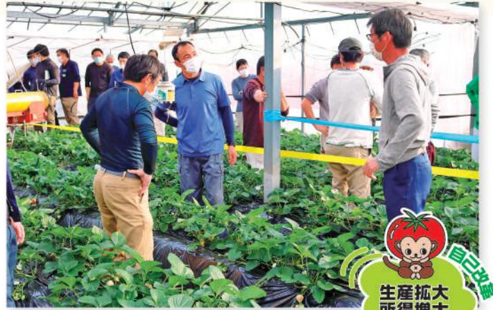
意見を交わす部員たち