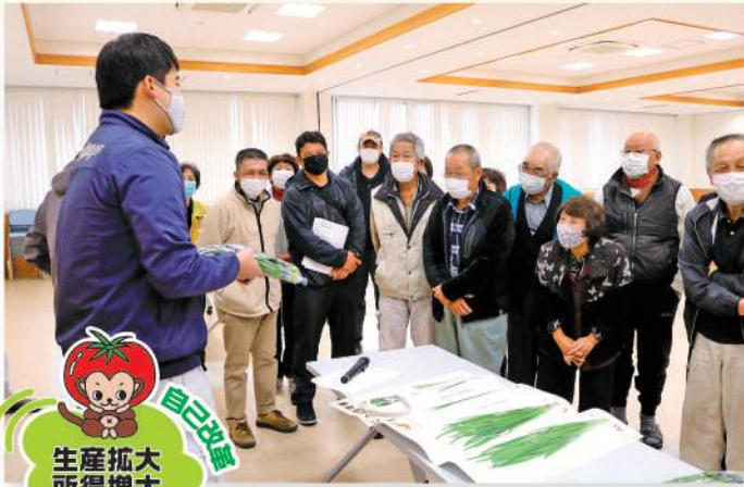
規格確認を行う部会員