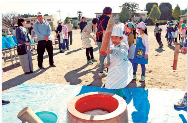
餅つきをする児童

児童たちは、保護者やJA職員が蒸されたもち米をこねる作業や餅つきを見学し、自分たちで杵を持ち実際に餅つきを体験しました。初めての経験に児童は「お米がお餅になっていくのがすごかった」「自分たちでついたお餅を早く食べたい」と笑顔で話しました。