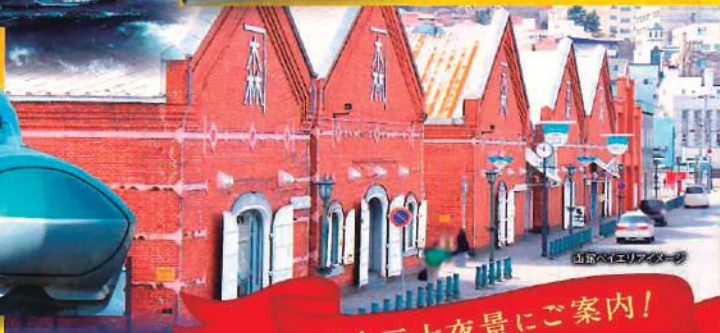
山手ベルエリカイメージ