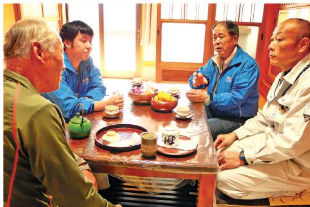
非常勤理事による訪問活動開始

当JAではJA自己改革の一環として担い手訪問活動を行っています。営農経済部門と信用共済部門の担当者が2人1組となり「担い手応援隊」として、担い手を訪問し情報提供や要望・意見を聞き「農業者の所得増大」・「農業生産の拡大」・「地域の活性化」を目指し出向く体制を強化することが目的です。