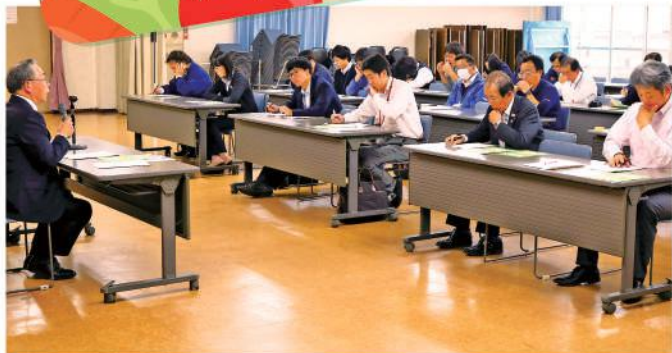
勉強会でレベルアップを図る応援隊

JAかみつがは10月30日、JA本店で、担い手応援隊（事業間連携担い手訪問活動）勉強会を行いました。JA常勤役員や支店長、渉外担当者らが参加し応援隊の強化を図りました。