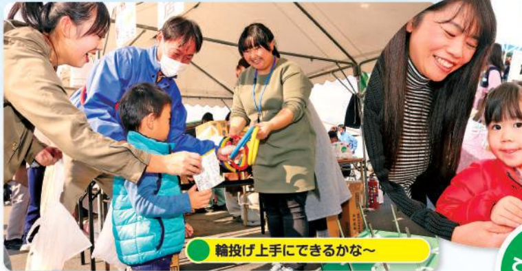
輪投げ上手にできるかな～