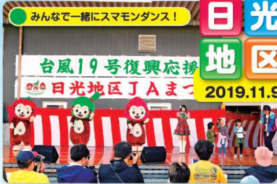
みんなで一緒にスマモンダンス!