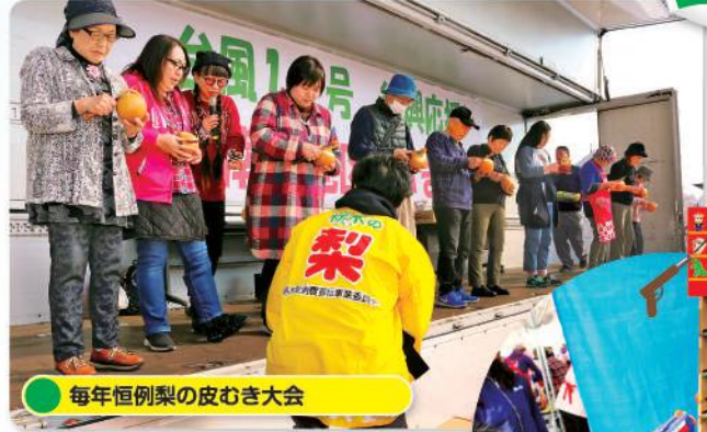
毎年恒例梨の皮むき大会