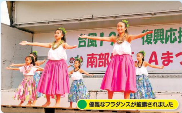
優雅なフラダンスが披露されました