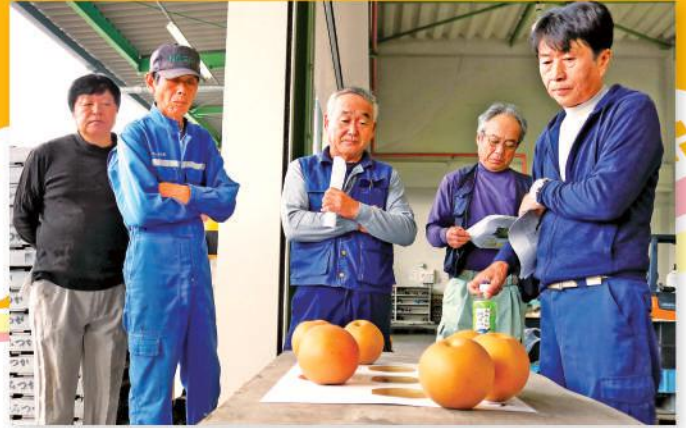
現物を確認する部員

目ぞろえ会では、上都賀農業振興事務所担当者、JA職員が大きさやカラーチャートなどを説明。生産者たちは現物を手に取り、出荷規格を確認しました。