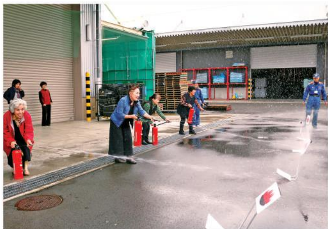
消火体験を行う会員