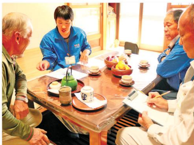
活発な意見交換が行われました

JAかみつがでは、11月5日から非常勤理事による担い手訪問活動を始めました。地元理事の訪問によって、担い手農家から普段聞き取れないような率直な意見を聞き出すことが期待されます。