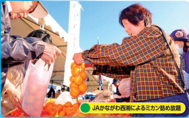
JAかながわ西湘によるミカン詰め放題