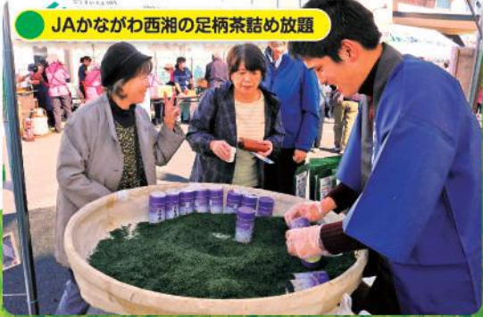
JAかながわ西湖の足柄茶詰め放題