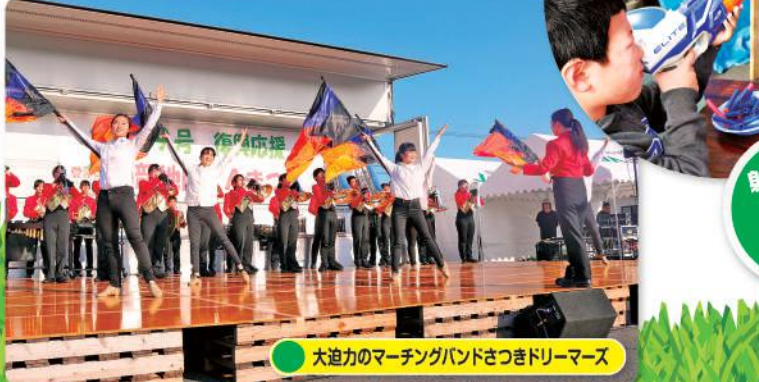
大迫力のマーチングバンドさつきドリーマーズ