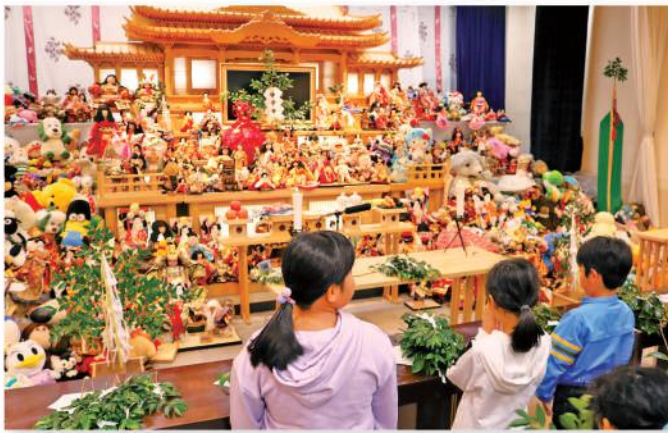
人形に別れを告げる参加者

供養祭後には、特賞の旅行券や家電製品等が当たるビンゴゲームが開かれ、盛り上がりを見せました。会場の外では、両協力会による模擬店が開かれ、大人から子供まで人形供養祭イベントを楽しみました。