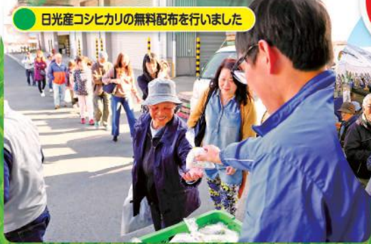
日光産コシヒカリの無料配布を行いました