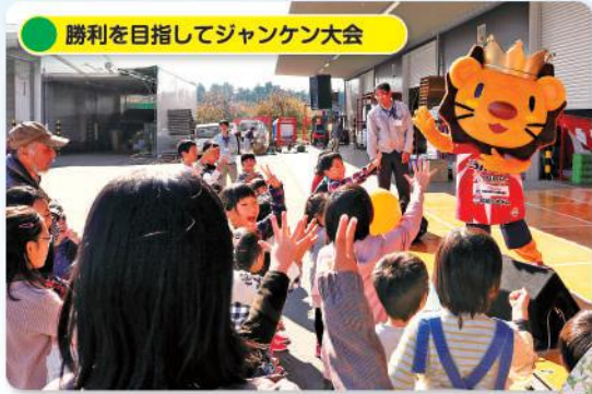
勝利を目指してジャンケン大会