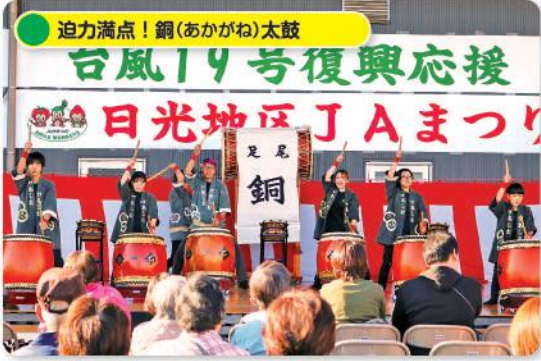
迫力満点! 銅(あかがね)太鼓 台風19号復興応援 日光地区JAまつり