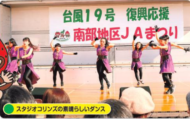
スタジオコリンズの素晴らしいダンス