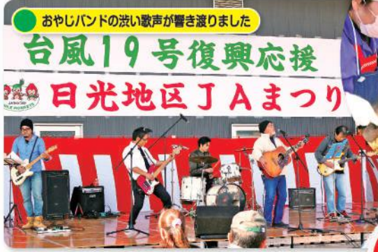
おやしバンドの洗い歌声が響き渡りました 台風19号復興応援 日光地区JAまつり