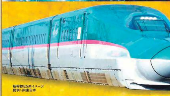
新幹線E5系イメージ