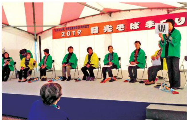
クイズを出題する会員