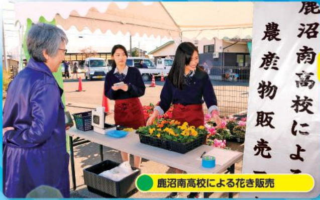
鹿沼南高校による花き販売