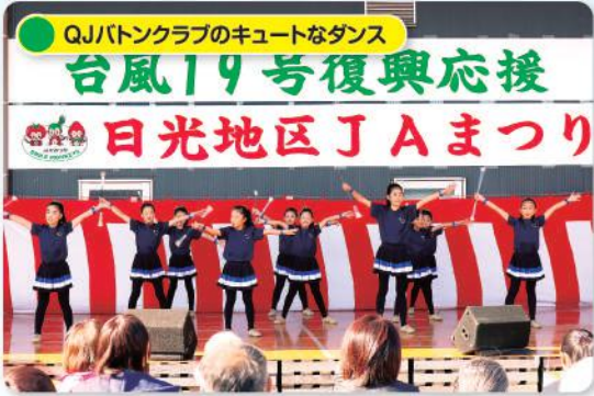
QJバトンクラブのキュートなダンス 台風19号復興応援 日光地区JAまつり