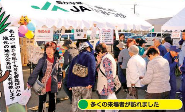
多くの来場者が訪れました