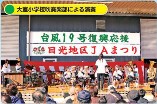
大室小学校吹奏楽部による演奏