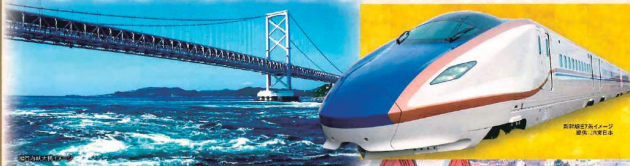
阿波岐大橋イメージ