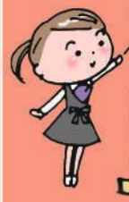
イラスト: 小林裕美子

シュンギクのプロフィール 【分類】キク科 【原産地】地中海沿岸 【おいしい時期(旬)】冬(10~3月ごろ) 【主な栄養成分】β-カロテン、食物繊維、カリウム、葉酸など 解説: KAORU