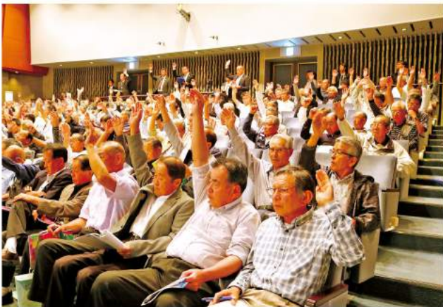
賛成の挙手をする総代