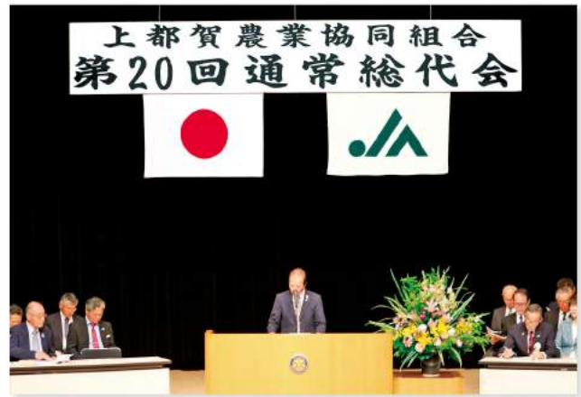
あいさつをする大橋組合長