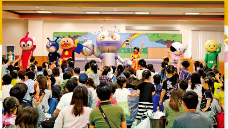
元気にゲームに参加する子どもたち

イベントに参加した子どもたちは「楽しかった」「アンパンマンたちがかっこよかった」「ルールをしっかり覚えた」と話しました。