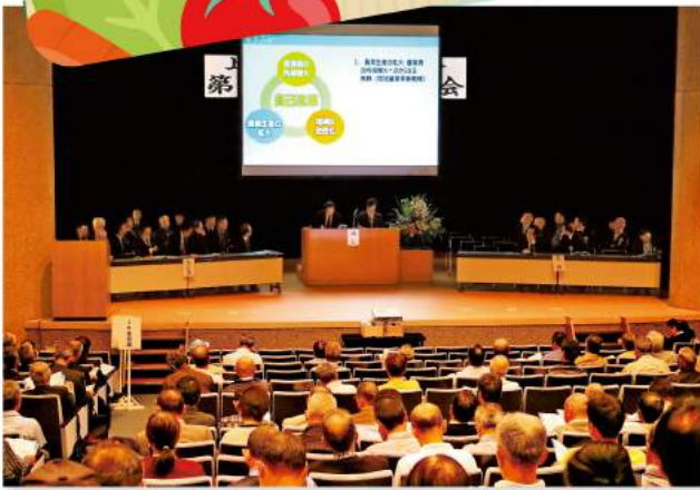
映像資料で説明が行われました

JAかみつがは5月29日、第20回通常総代会を鹿沼市民文化センターで開きました。総代503名（本人出席236人・書面出席267人）が出席しました。