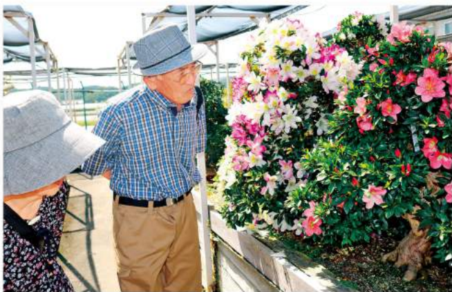
サツキに見とれる来場者