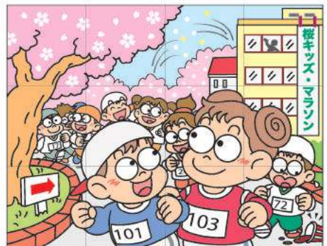
出題・イラスト：酒井栄子