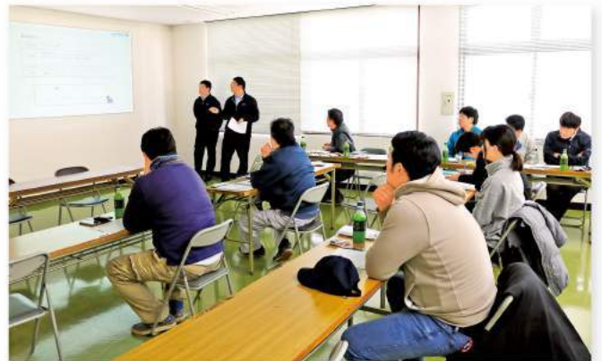
真剣な面持ちで事故の原因を学ぶ会員

講習会では、栃木スカイテック(株)が講師となり、ドローンによる薬剤散布を安全に行うための取扱方法や実際の事故事例などを説明しました。会員は散布場所の下見、オペレーターとナビゲーターの連携の重要性などを再確認しました。