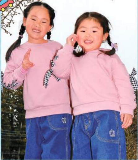
二人で仲良く笑顔でポーズ