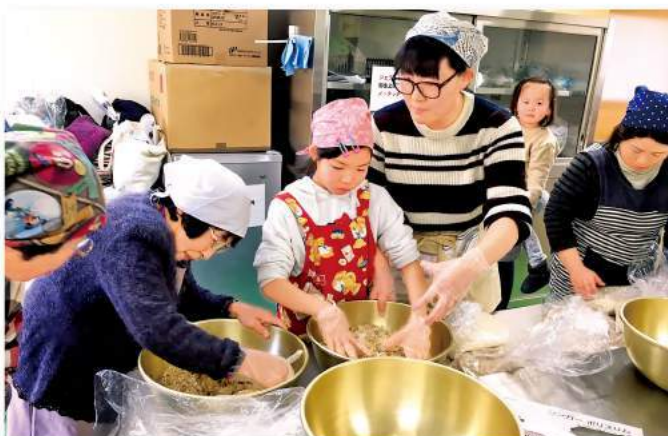
料理教室を楽しむ親子

参加した親子は「毎年ここで作る味噌を楽しみにしている」と話し、調理後手作りあんこの美味しさを味わいました。