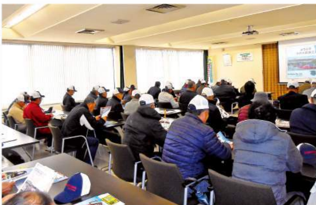
真剣に講習を受ける参加者