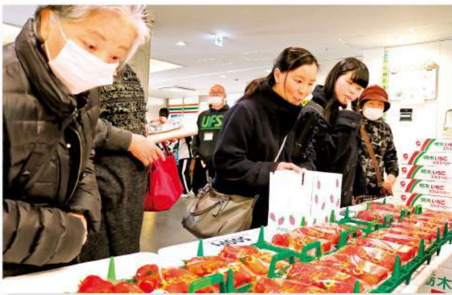
イチゴ販売で賑わう来場者