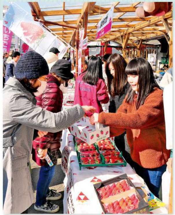
販売コーナーは大盛況でした

いちご市（鹿沼市）は2月17日、鹿沼市花木センターで「いちごのもり」イベントを開きました。2016年11月に鹿沼市がいちご市を宣言。「いちごのもり」は鹿沼市をよりイチゴ色に染めたいという願いを込めて昨年から開催されています。