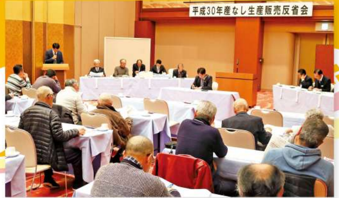
次年産に向けて検討する部員ら