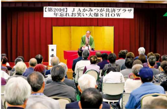
会場には笑い声が響き渡りました

JAかみつが共済プラザは12月3日、鬼怒川温泉で第20回「年忘れお笑い大爆SHOW」を開きました。