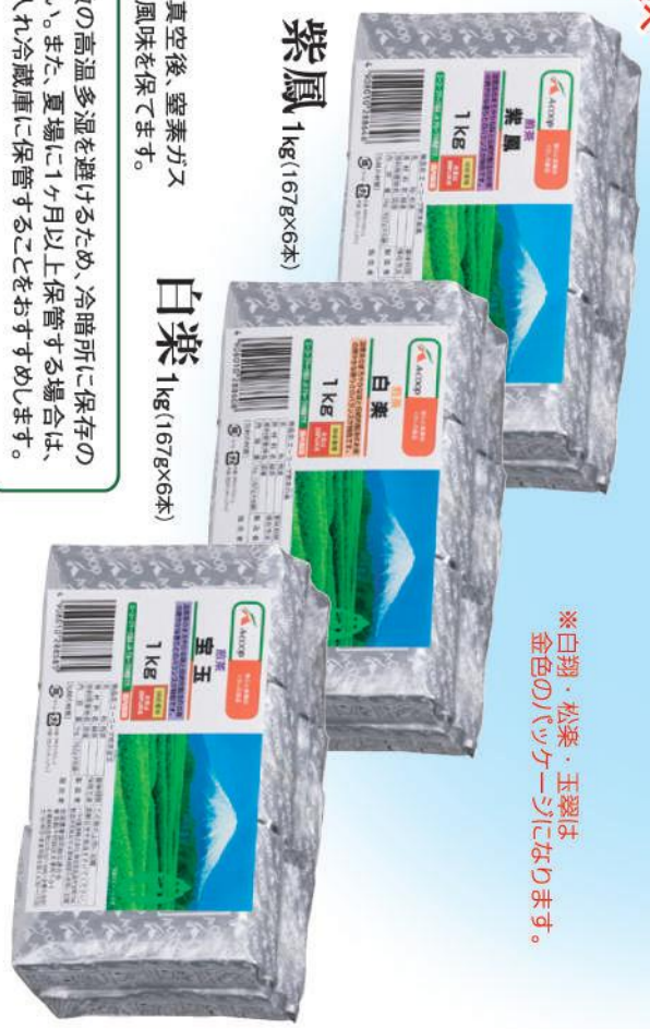
※白羽・松葉・玉翠は 金田の「ツケナー」になります。