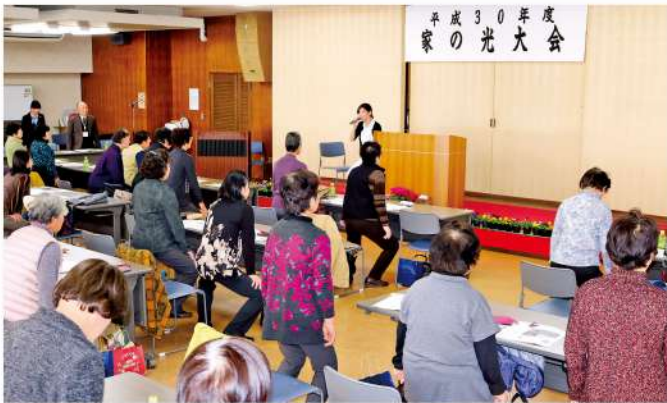
参加者みんなで楽しく健康体操

JAかみつが女性会は12月10日、JAかみつが本店で平成30年度家の光大会を開きました。