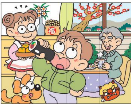
出題・イラスト：酒井栄子