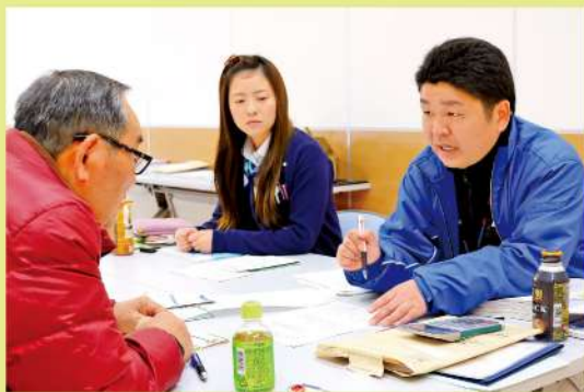
記帳の説明をするJA職員

相談者1人につき1時間程度、年末調整の確認と平成30年度の決算準備に向けた面談が行われ、記帳代行の説明をしました。