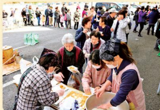
大沢直売所感謝祭 (12月9日)

各地では地元農産物を使った汁物や餅つき、新鮮野菜の直売など行われ、大いに賑わいました。ご来場いただきました皆様ありがとうございました。