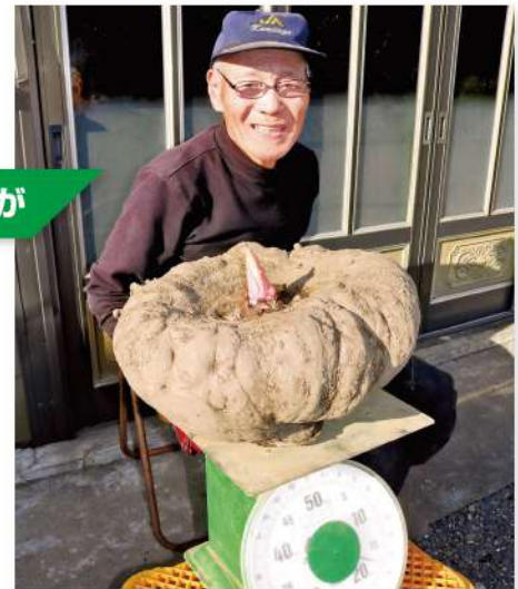
カボチャじゃないよ、こんにゃく芋だよ

品種は群馬県から導入したみやままさり。「大きく育つようにと管理してきたが、ここまで育つとは思っていなかった」と喜びの表情で話し、「目指すは日本一の30kgだ」と意気込みました。