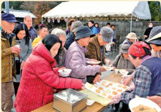
落合直売所収穫祭 (12月2日)