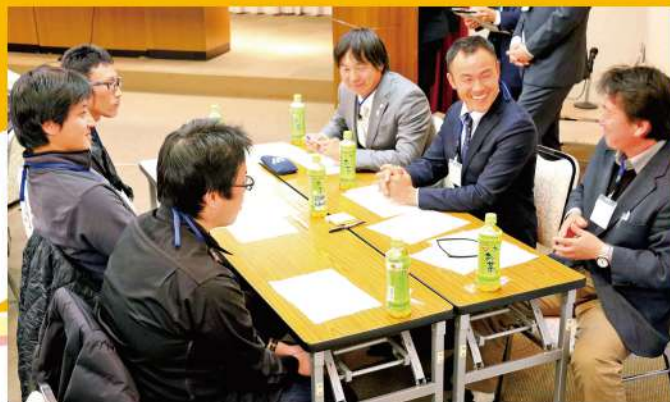
活発に意見を出し合う3JAの部員ら