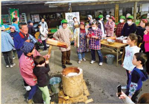
小林直売所収穫祭 (11月18日)

組合員や地域の皆様に感謝を込めて 各支店、各直売所で感謝祭や収穫祭が行われました