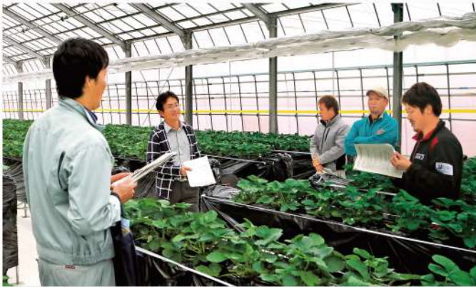
検討を行う会員たち

日光地区促成いちご協議会は11月13日、日光市内の生産者ほ場で現地検討会を開きました。会員7名が参加し生育状況を検討確認、上都賀農業振興事務所担当者が今後の栽培管理について説明しました。