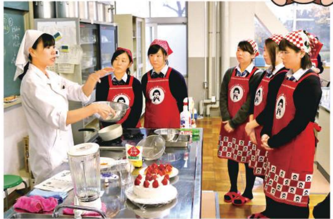
先生からカスタードの作り方を聞く高校生と職員

JAかみつがは11月19日、地域の食と農を振興する鹿沼南高校との交流を図るため、かみつが産のイチゴを使ったスイーツ作りを行いました。鹿沼南高校クッキング部の1、2年生10人と、JAから入組2～3年目女性職員6人が地域貢献研修として参加しました。