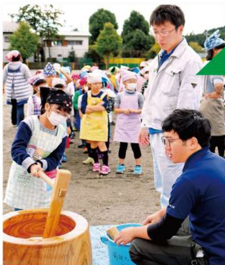
餅つきをする児童