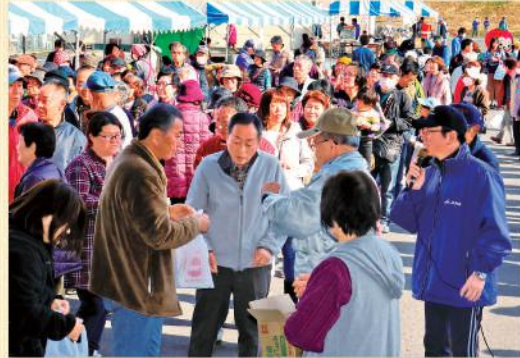
菊沢支店感謝祭 (12月1日)