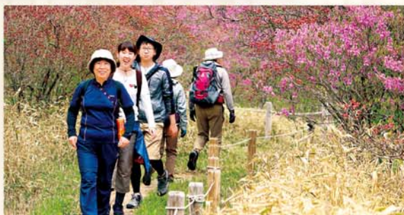
毎年好評のウォーキング大会

また、地域に密着した情報を発信していく「支店だより」を作成し、組合員地域住民との繋がりを広げていきます。