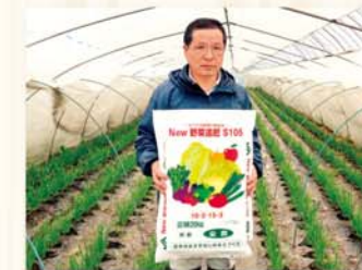
実際に担い手の意見が反映されオリジナル肥料が開発されました

平成28年11月から事業間連携による担い手訪問活動に取り組み、営農経済渉外・信用共済渉外が2人体制（担い手応援隊）で担い手農家を訪問し、意見要望を伺うと同時に情報提供に努めています。