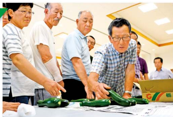
選別基準を確認する部会員

サンプル品をもとに、傷や曲がり具合の選別基準を丹念に確かめ、集出荷時の注意点や今後の課題などを話し合いました。市場関係者は「日光のズッキーニは有名産地にも引けをとらない品質。さらなる高品質の物を出荷してほしい」と呼びかけました。