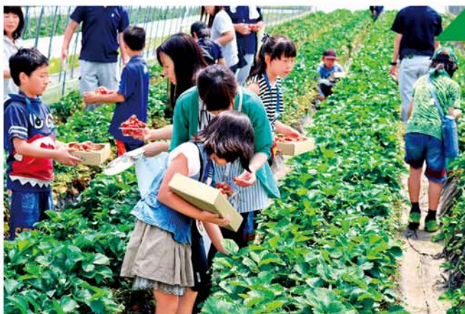
イチゴ狩りを楽しむ参加者

次に、南部営農経済センター青果物総合集出荷場で、トマトの選果の様子を見学し、同センター内で農産物栽培学習会、JA事業の説明を行いました。クイズ大会ではスマイルモンキーズが登場し、終始賑やかな雰囲気での体験学習となりました。