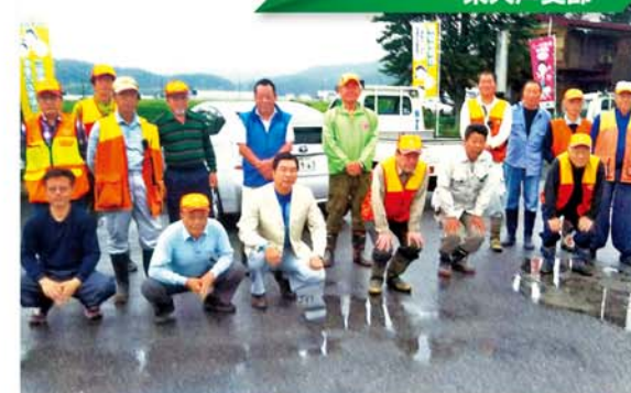
鳥獣捕獲に向けて出発式

農政対策協議会東大芦支部では東大芦地区の猟友会に有害鳥獣駆除の依頼をしています。5月19日～6月9日までの土曜日に毎年恒例の管内の鳥獣捕獲を行いました。参加した猟友会の人数は通算延べ124人となりました。