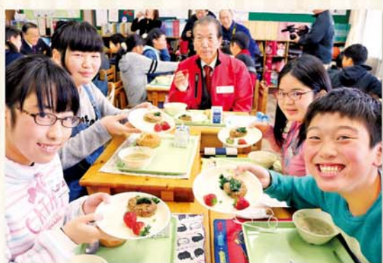
学校給食にいちご贈呈