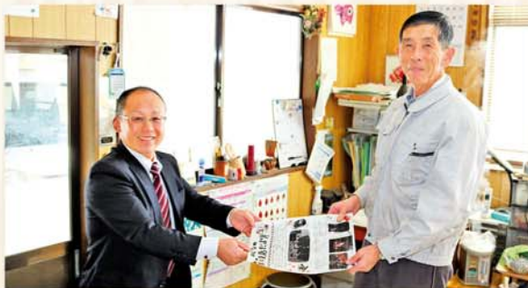
支店だよりの作成で地域振興を目指します