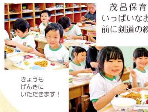
きょうもげんきにいただきます!

茂呂保育園ぞう組43名の元気いっぱいなお友だち。今日は給食の前に剣道の練習をしました。いっぱい運動したのでお腹ペコペコです。園児たちは「お昼ごはんがとってもおいしいよ」と笑顔でランチタイムを楽しんでいます。