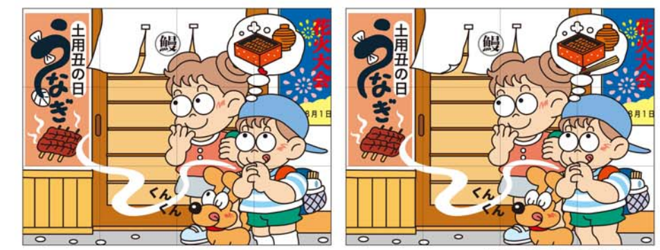
出題・イラスト：酒井栄子

右のイラストには左のイラストと違う部分が5か所あります。間違っている部分を左下の枠内の数字で探しましょう。