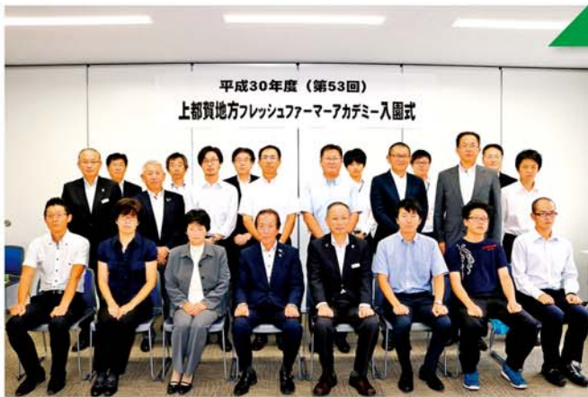
平成30年度入園生と役員

受講生は来年の3月まで月に一度のペースで、農業に必要な知識や技術を習得していきます。