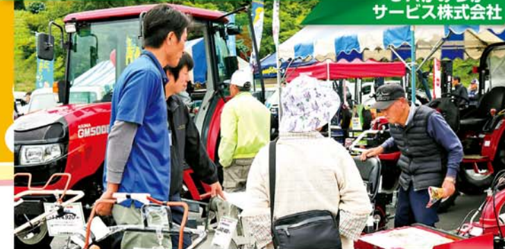
職員から説明を受ける来場者

JAかみつがサービス株式会社は6月16・17日、鹿沼市花木センターの特設会場で夏季展示会を行いました。