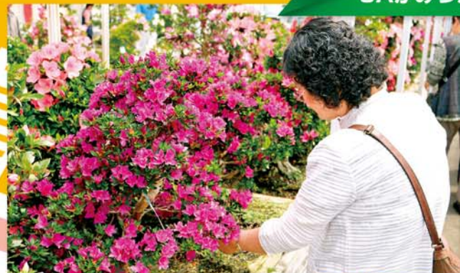
サツキに見とれる来場者

第47回鹿沼さつき祭りが5月26日～6月4日の10日間、鹿沼市花木センターとJA花木センターで開かれ、色とりどりのサツキに来場者は感嘆の声を上げました。