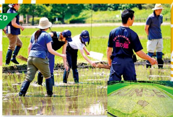
学生と協力して田んぼアートを作成

約10アールの水田に学生が考案した「ユウノサト」×「BUNSEI」の文字を描き、地域住民と学生達の絆を表した田んぼアートが完成しました。