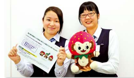
自己改革パンフレット作成