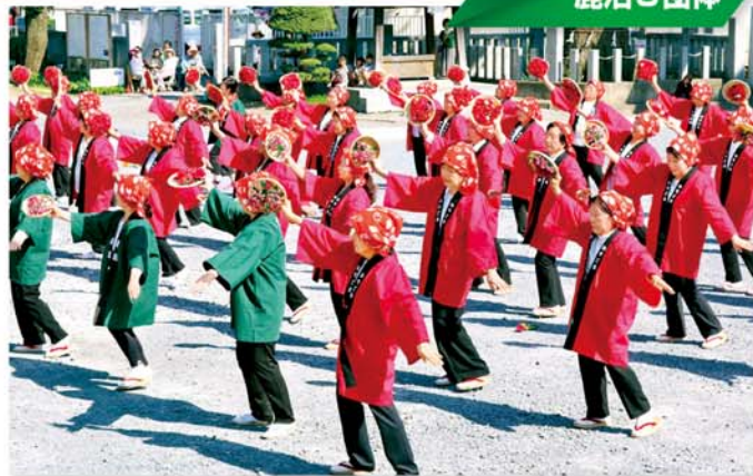
今宮神社にいちご音頭奉納

イチゴの豊作と繁栄を祈念し、鹿沼民謡舞連合会、鹿沼市老人クラブ連合会、鹿沼市日本舞踏部会の3団体は5月5日、「いちご市」鹿沼、「いちご王国」栃木をPRするため、今宮神社に栃木いちご音頭の歌と踊りを奉納しました。同神社にいちご音頭を奉納するのは今年が初めてです。