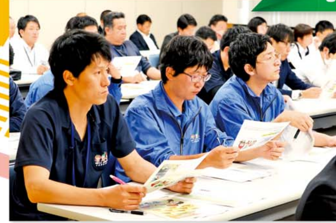
熱心に話を聞く職員

JAかみつがは5月9日と14日に、日光宮農経済センター、南部宮農経済センターで事業間連携担い手訪問活動（担い手応援隊）の報告会を行いました。