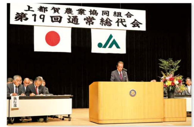
あいさつをする大橋組合長