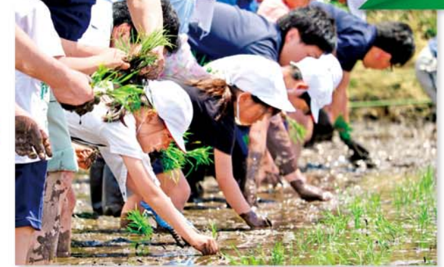
田植えを体験する児童

鹿沼市立菊沢東小学校の2年生64人が5月14日、同校「ふれあい農園」で田植えの体験学習を行いました。天候にも恵まれ、児童は笑顔で「楽しい」「もっとやりたい」「気持ちいい」と泥だらけになりながらも