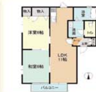
鹿沼市玉田町 2LDK(42.36㎡) 47,000円