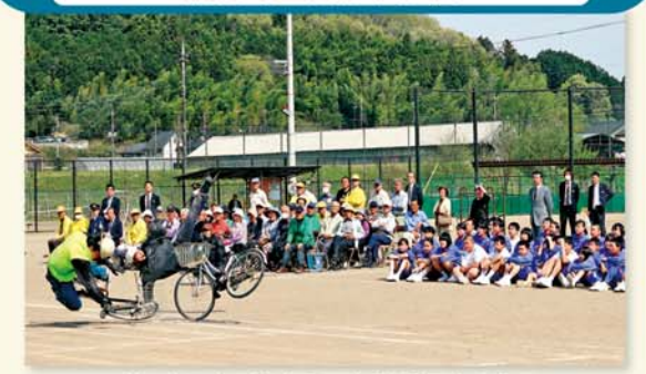
自転車同士の衝突場面を学ぶ児童と住民

JAかみつがとJA共済連は4月12日に鹿沼市立南摩中学校で、生徒向け自転車交通安全教室を開きました。同中学校全生徒70人と、南摩地区住民、上南摩小学校・南摩小学校5・6年生計50人が参加しました。