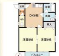
鹿沼市緑町 2DK(38.88㎡) 40,000円