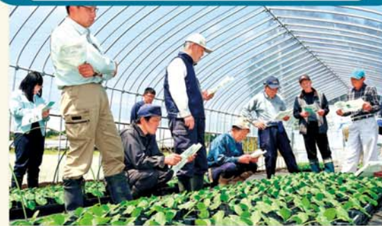
苗の生育状況を確認する部会員

日光青果協議会ズッキーニ専門部会は4月19日、日光市内の生産者ほ場でズッキーニ苗現地検討会を行い、生育状況などを確認しました。生育状況は概ね順調に進んでいます。