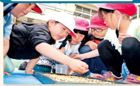
早くお米になれと種をまく児童

鹿沼市立菊沢東小学校では児童が学年ごとに違う品目の作物づくりを学ぶ農業体験学習を実施しています。米作りを学ぶ2年生64人は4月18日、同校校庭でもち米の種もみをまく体験をしました。