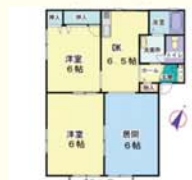
鹿沼市玉田町 3DK(54.81㎡) 44,000円