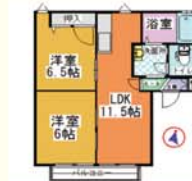
鹿沼市西茂呂 2LDK(50.78㎡) 48,000円

ホームページ: http://jakamituga.jp/ メール: sisan@ja-kamituga.or.jp