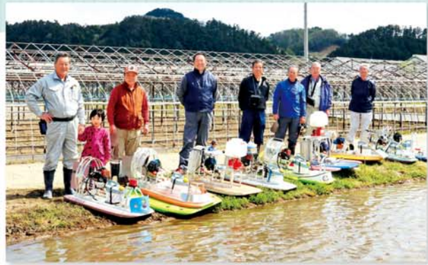
俺たちのラジコンボート

管内ではラジコンボートやドローンなど、農業者の負担減少のために様々な取り組みが行われています。労働時間の削減や、田んぼに入らず除草剤や追肥を散布できるなど数多くの利点があり、今後更に取り組みが拡大していくと思われれます。