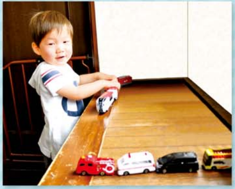
元気いっぱい出発進行

梗一郎くんは2歳になったばかり。ご飯と味海苔が大好きで、元気いっぱい活発な男の子です。