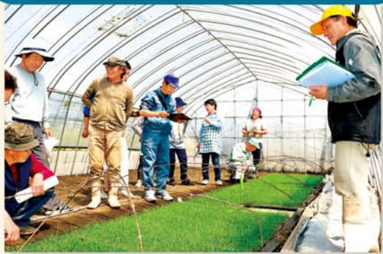
苗の生育状況を確認する部会員

日光青果協議会日光にら専門部会は4月20日、日光市内の生産者ほ場でにら苗現地検討会を行い、生育状況などを確認しました。