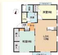
鹿沼市西茂呂 2LDK(54.81㎡) 45,000円