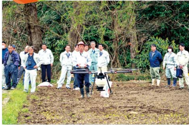
飛び立つドローン