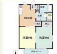
鹿沼市西茂呂 2DK(38.83㎡) 41,000円