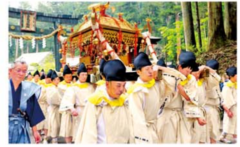
日光東照宮春季例大祭の神輿渡御