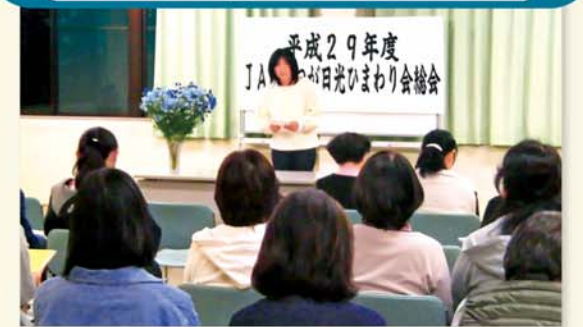
熱心に話を聞く会員

JAかみつが日光ひまわり会は4月10日、JAかみつが福祉グループで平成29年度総会を開きました。平成29年度の事業内容・決算報告と、平成30年度にむけての事業計画及び収支予算を承認しました。任期満了による役員改選が行われ、新役員は次の通り。(敬称略)