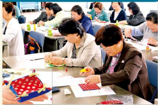
手作りミニトレーを製作する会員

JAかみつが女性会は4月4日、本店で第18回通常総会を開き、事業報告と収支決算など3議案を承認しました。