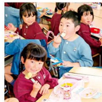
今日も元気にいただきます！

見望台幼稚園つばめ組54名の元気いっぱいなお友だち。今日は楽しいお弁当の日。手づくりのお弁当がとってもおいしそう。園児たちは「おいしいごはんが大好き」と笑顔でランチタイムを楽しんでいます。