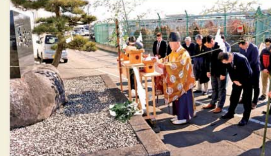
牛魂碑前で祈る参列者

上都賀農協和牛肥育部鹿沼・西方支部は2月9日、南部営農経済センター敷地内の牛魂碑前で平成30年度牛魂祭を執り行いました。