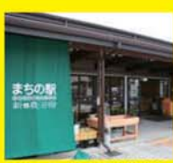
まちの駅 新・鹿沼宿物産館