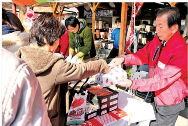
イチゴを販売する組合長

いちご市（鹿沼市）は2月18日、鹿沼市花木センターで「いちごのもり」イベントを開きました。これは鹿沼市がいちご市宣言をして1年、もっと鹿沼市をイチゴ色に染めたいという願いを込めて開催。同市は今年で70周年を迎えます。栃木県やJAかみつがなどが後援しイベントを盛り上げました。