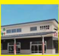
日光森友直売所スマイル館