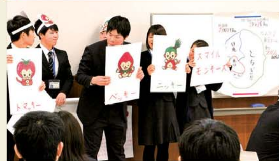
JAかみつがの特徴を説明する職員

JA栃木中央会は2月14日、真岡支店で、当JA、JAうつのみや、JAはが野と合同で、平成29年度新入職員地区別交流会を開きました。