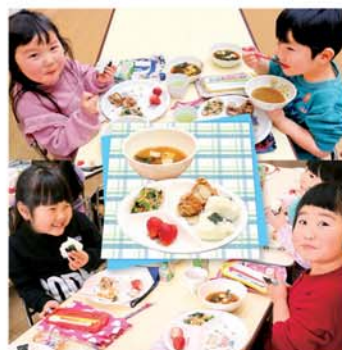
おにぎり・イチゴとってもおいしいね

青い鳥幼稚園うぐいす組の39名の元気いっぱいのお友だち。今日は楽しいごはん給食。ごはんをおにぎりにしておいしくいただきます。イチゴはJAかみつがの朝どりイチゴ「とちおとめ」。園児は「甘～いイチゴが大好き」と笑顔でランチタイムを楽しみました。