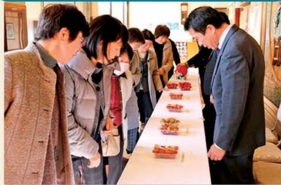
出荷規格を確認する女性部員

上都賀農協いちご部は2月6日、鹿沼市で平成30年産イチゴ婦人目ぞろえ会を開き、部会の女性など150人が出席。消費者の立場での選果選別し、収穫時カラーチャート2番の品質を重視した着色規格を申し合わせました。