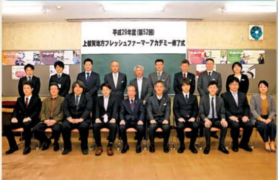
第52回修了生の皆さん

上都賀農業振興事務所は3月9日、同事務所会議室で平成29年度（第52回）上都賀地方フレッシュファーマーアカデミー修了式を開きました。修了生12名が修了証書を受け取り、農業者としてのスタートを切りました。