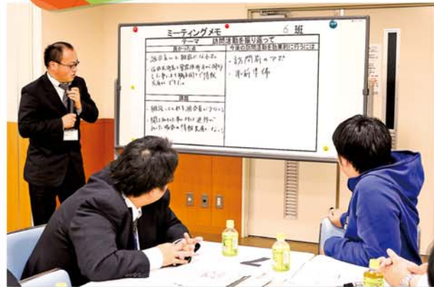
ミーティング内容を発表する職員

JAかみつがは3月6日、7日、日光宮農経済センター、南部宮農経済センターで事業間連携担い手訪問活動（担い手応援隊）全体ミーティングを行いました。JA常勤役員、職員120名が参加しました。