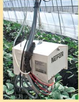
●写真2 環境測定センサー