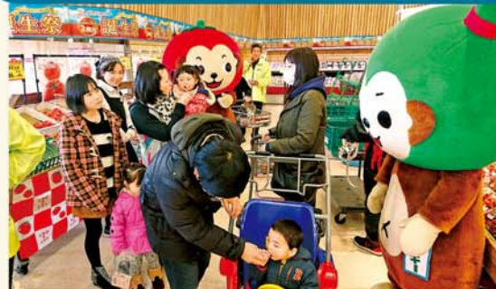
かみつが農産物を試食する消費者

JAかみつがは3月10日に岩手県盛岡中央青果取引量販店舗にて販売促進を行いました。同JAの主要青果物(イチゴ、ニラ、トマト)3部の役員、全農とちぎ担当者などが参加し、試食宣伝会を行い、各店舗で大盛況となりました。