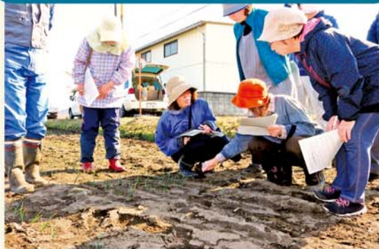
ほ場を確認する組員

小林地区玉ねぎ生産組合は3月14日、組合員宅のほ場で平成30年産のたまねぎ現地検討会を開きました。