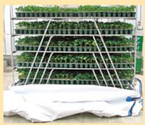
●写真1 炭酸ガス処理を行う装置