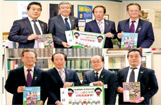
両教育長へランチョンマットを贈呈

JAグループ栃木は安全で安心な県産農畜産物を食べて健やかに育ててもらおうと、県内小学校の新入生に学校給食で使うランチョンマットを贈っています。