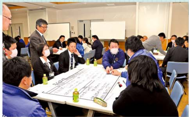
担い手訪問について話し合う職員