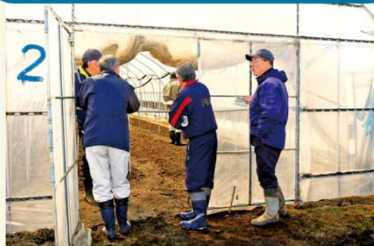
ほ場を確認する部会員

日光青果協議会アスパラガス専門部会は2月27日、日光市内の生産者ほ場で、アスパラガス(春芽)現地検討会を開きました。ハウス内の温度や湿度等の環境を確認し、検討しました。