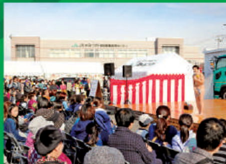
アキラ 100%のお盆芸に釘づけ