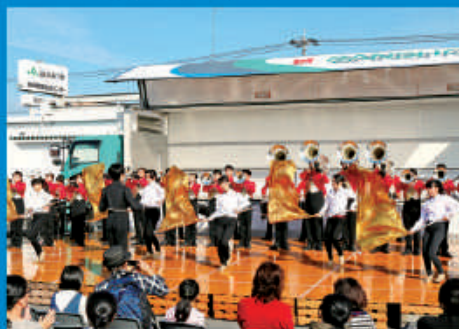
さつきドリーマーズの素敵な演奏でした!