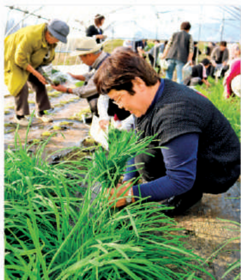
ニラを刈り取る参加者