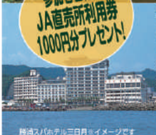
勝浦スパホテル三日月 ※イメージです