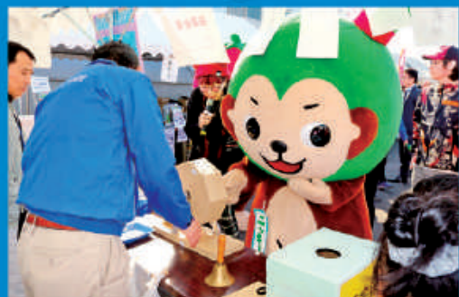
スマイルモンキーズも組合員抽選会に挑戦