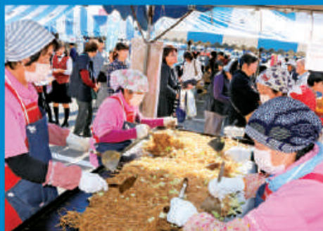
大人気! 日光女性会特製焼きそば