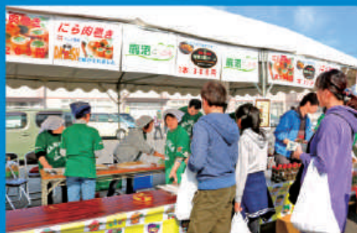
テレビでも紹介された鹿沼のニラ!!