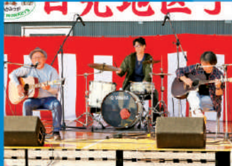
流くてかっこいい! おやしバンド