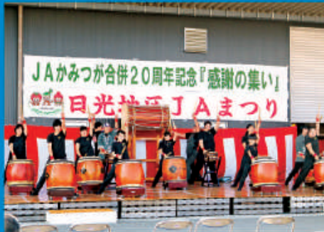
銅(あかがね)太鼓(和太鼓)による演奏