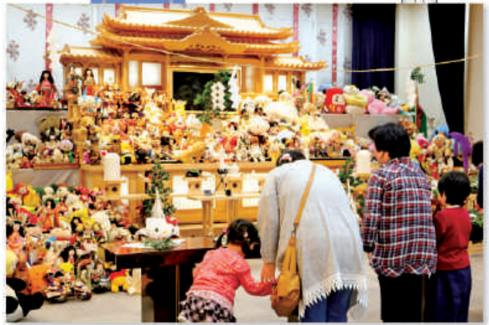
人形に別れを告げる参列者