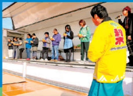
毎年恒例梨の皮むき大会