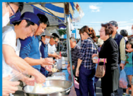
日光青年部のお餅も大好評