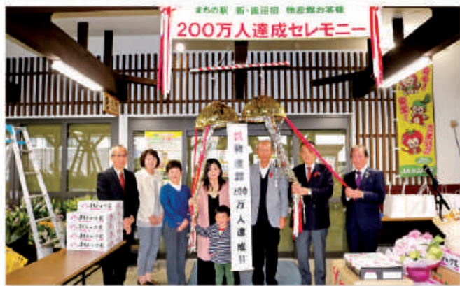
来館200万人達成記念セレモニー