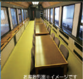
お座敷列車 ※イメージです