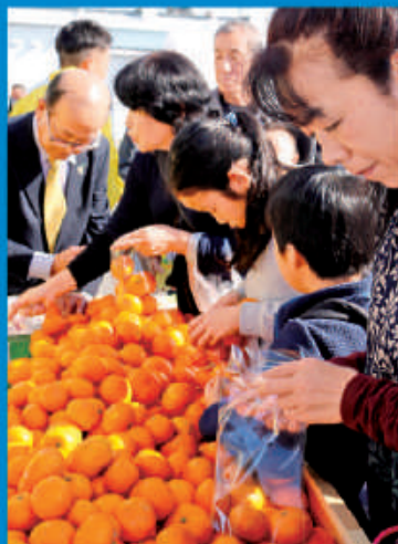
毎年大好評! JAかながわ西湘の みかん詰め放題