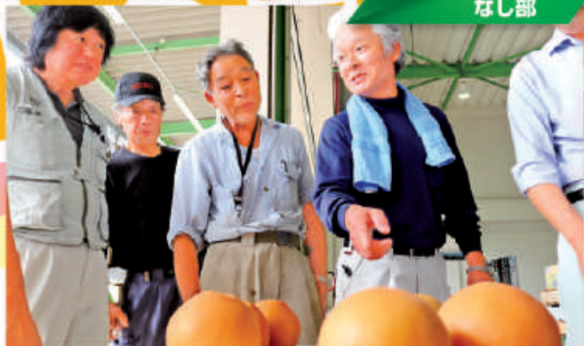
出荷規格を確認する部員ら

上都賀農協なし部は10月9日、南部営農経済センターで、平成30年産「にっこり」目ぞろえ会を開きました。同日「にっこり」の初出荷を行い、生産者、関係者ら20名が参加しました。今年産の「にっこり」の生育は天候の影響により平年より早く、着果数も増加。果実の肥大も平年並み～やや小玉傾向です。