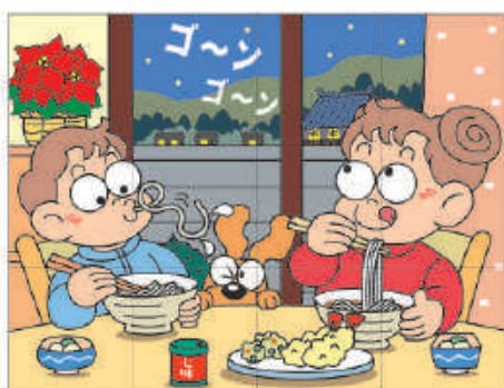
出題・イラスト：湯井栄子