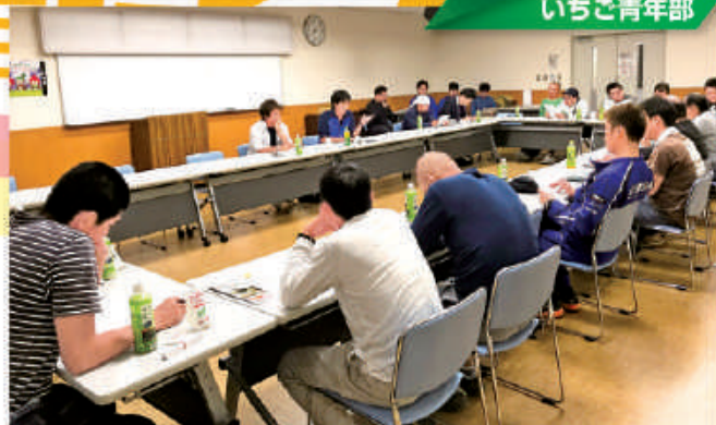
検鏡結果報告を聞く参加者

上都賀農協いちご青年部は10月12日、花芽腋花房検鏡報告会を開きました。参加者は平成31年産のイチゴの生育状況を確認し意見交換・情報提供を密に行いました。