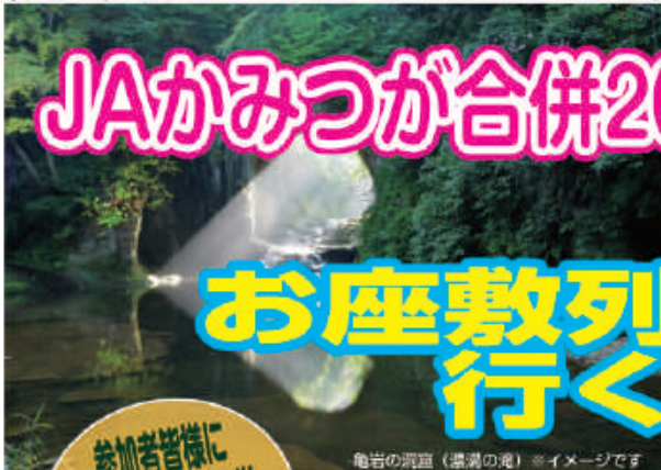
龍岩の滝 (龍川の滝) ※イメージです