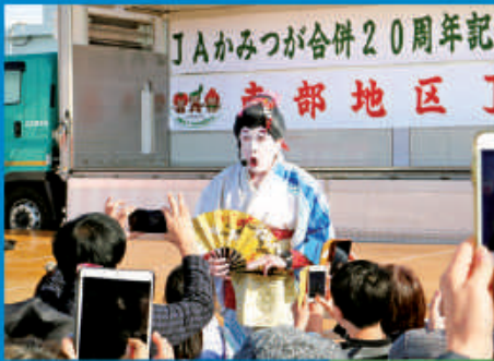
ちっくしょー!! 炸裂のコウメ太夫