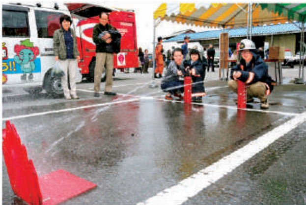
防火衣を着用して消火体験