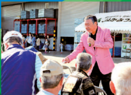
吉幾三? あっち幾三だよ