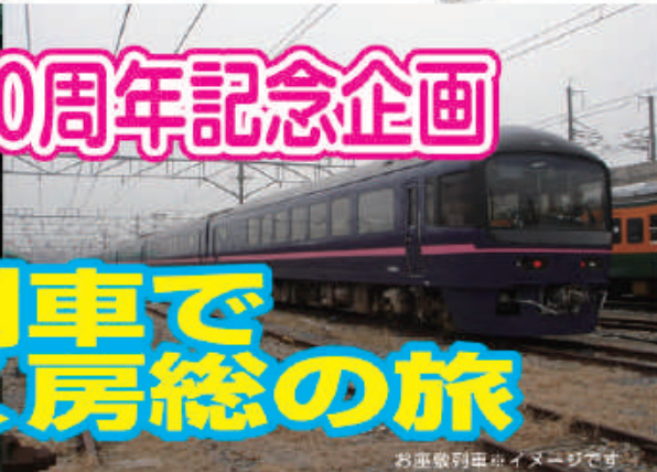
お座敷列車 ※イメージです