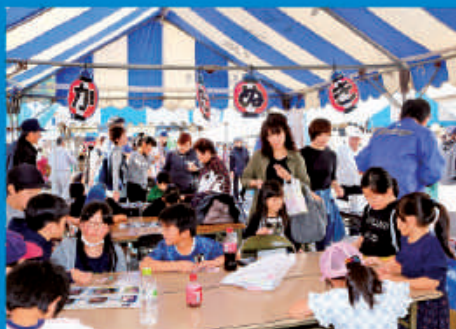
子どもたちが夢中でかためき