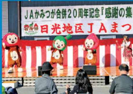
ガールズq/bのしーにゃんと一緒にダンス!