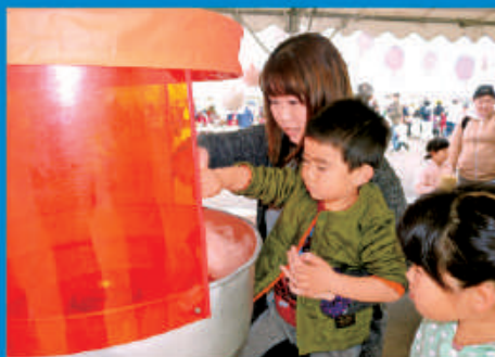
大きなわたあめ作れるかな?