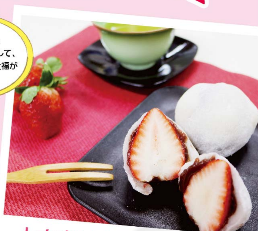
とちあいかのいちご大福