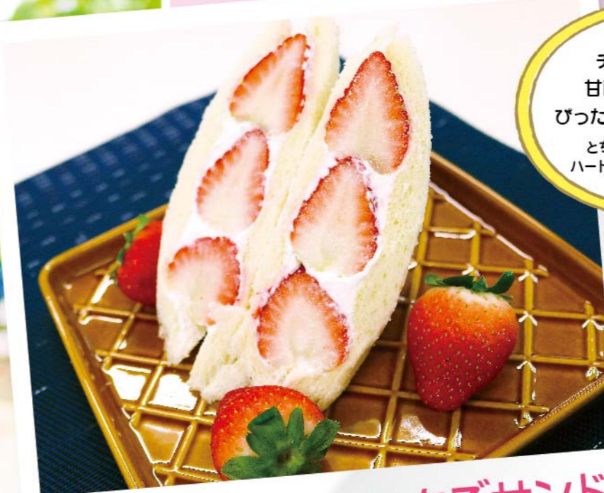
チーズクリームのいちごサンド