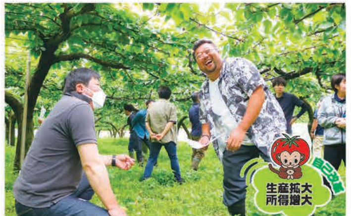
圃場の生産状況を確認する参加者