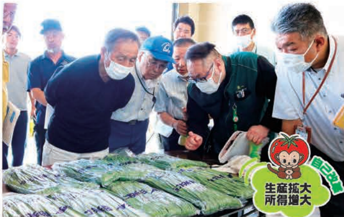
出荷規格を確認する部会員