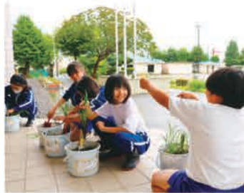
6月18日 日光市立今市第二小学校