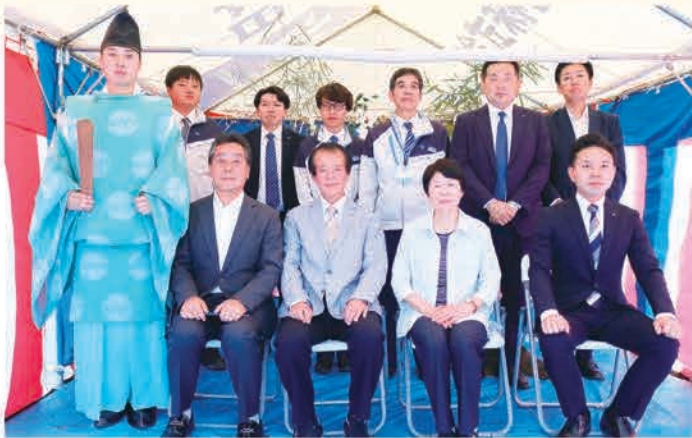
手塚さん夫妻(前列中央)と関係者