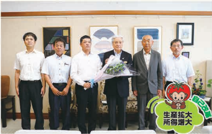
リンドウの花束を福田知事(右から三番目)に贈呈する会員ら