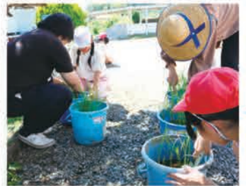
6月19日 鹿沼市立永野小学校