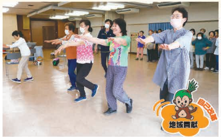
歩行運動を行う参加者