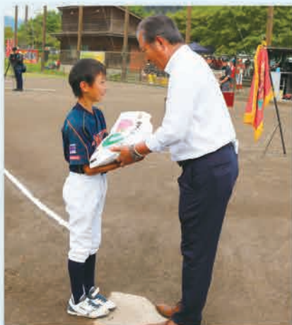
JAかみつがブランド米 日光産コシヒカリ「しゃりまんてん」を全チームに贈呈