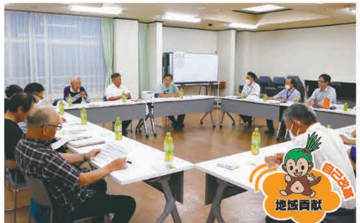
鹿沼地区運営委員会の様子(6月20日開催)