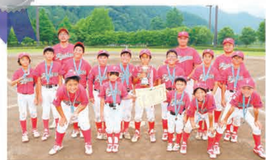
日光・今市ファイターズ A