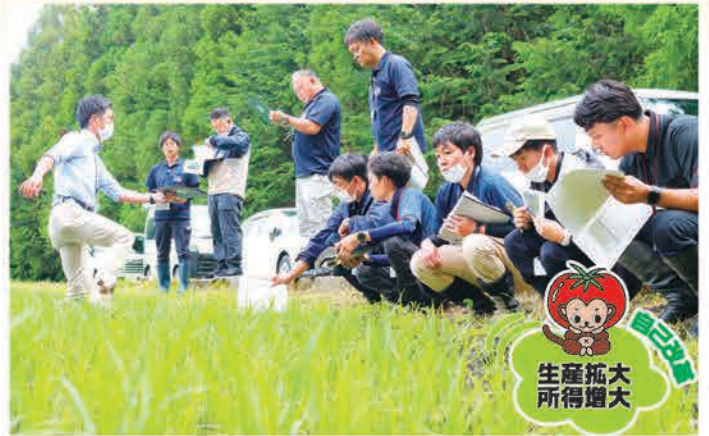
水田の生育状況を確認する参加者(日光市で)