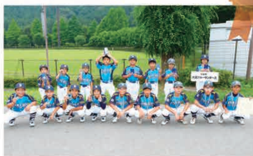
大室ブルーサンダース