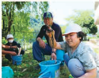
6月14日 鹿沼市立上南摩小学校