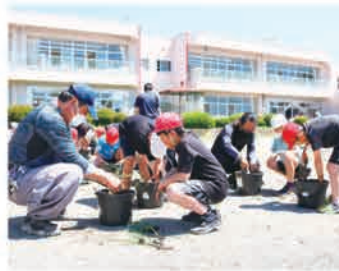
6月19日 鹿沼市立西小学校