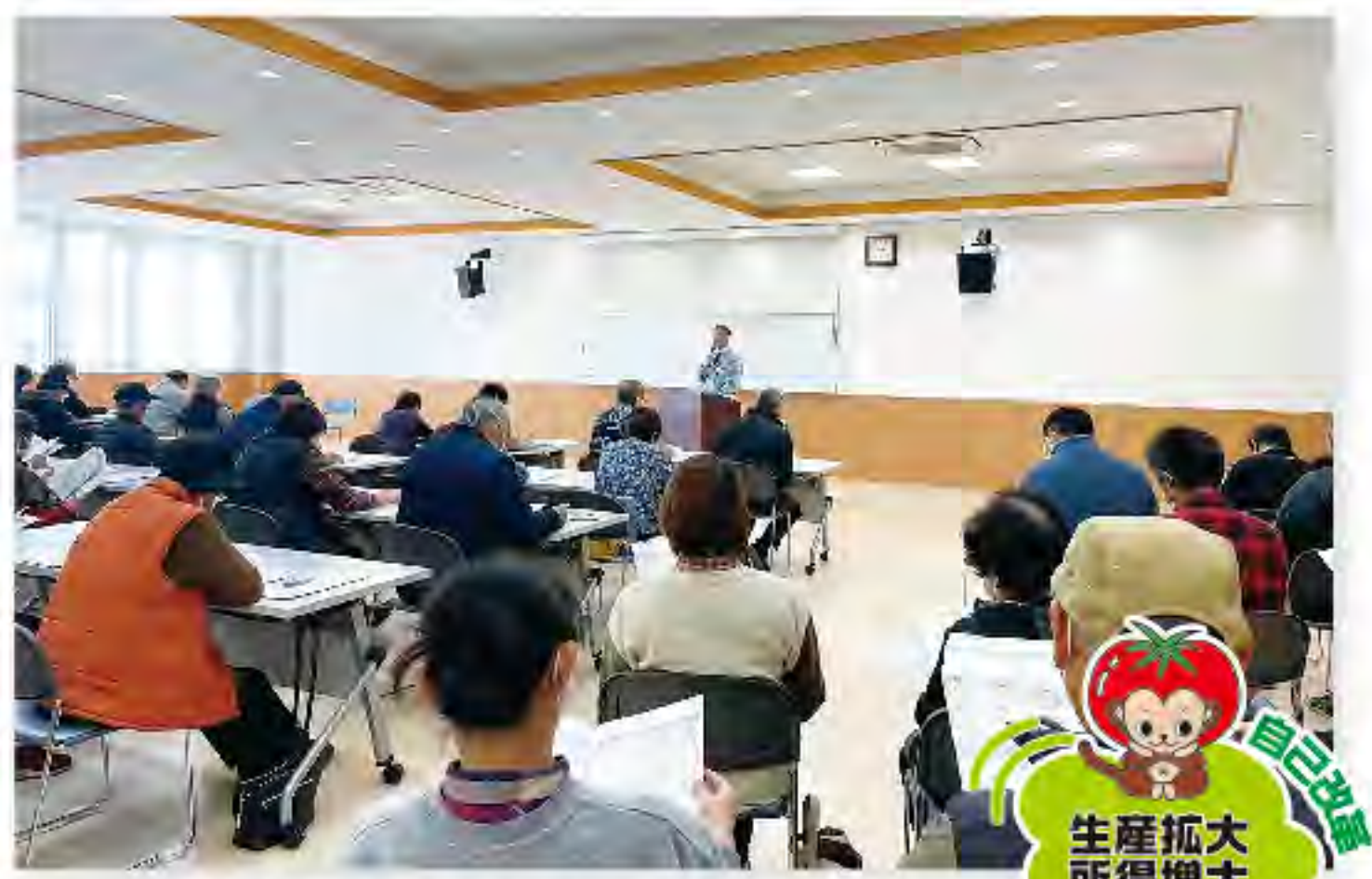
栽培管理や農薬使用について学ぶ参加者