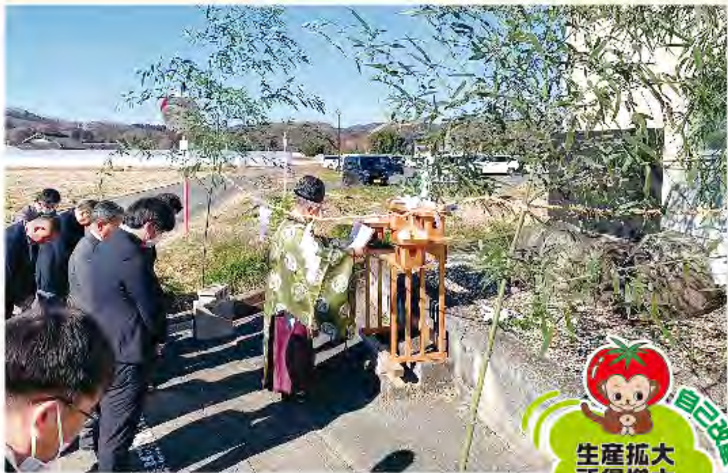
牛魂碑の前で祈禱する参加者ら