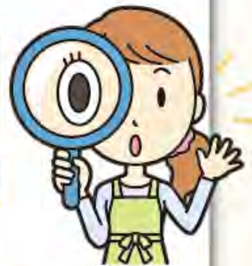
出題・パズルイラスト 酒井栄子